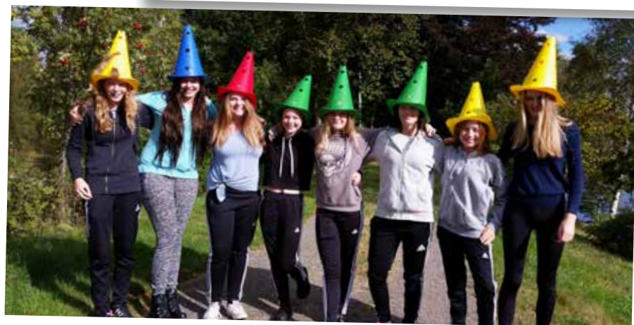
Konfirmander på läger