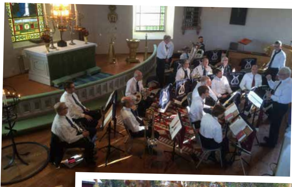
Musikkåren spelade i vår gudstjänst