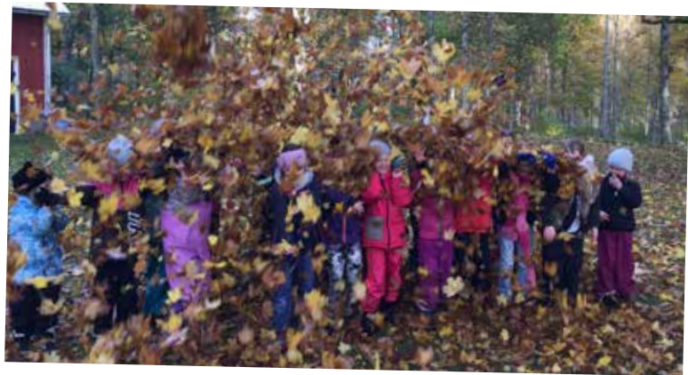
Miniorerna lekta i Skeppshult