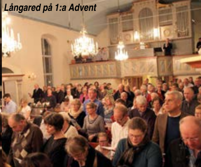
Långared på 1:a Advent