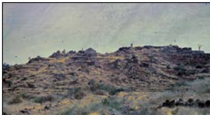
Här på kullen ligger den äldsta missionstationen.

Jag har sedan jag varit liten haft ett stort intresse för missionsarbete och nu den 15 mars är det faktiskt 150 år sedan som den första riktiga svenska missionen startade efter många år av förberedelser. Denna dag 1866 lade en båt till i Massawas hamn i Abessinien (nu Eritrea). Det blir början på en resa genom höga berg och svår terräng. Resan gick för de tre missionärerna (knappt fyllda 30år), till Kunamafolkets land. Här byggdes den allra första missionsstationen upp och här börjar man också med både Gudstjänster och undervisning.