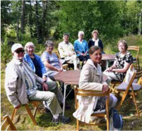
Vandringsgudstjänst i Lekåsa söndagen den 16 augusti.