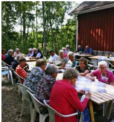
Fåglums kyrkliga syförenings trivselträff vid Kvarnen den 13 augusti