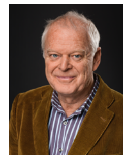
Thomas Hammarberg Europa kommissionär för mänskliga rättigheter mellan 06 och -12. Fr o m -14 ordf. i Kommissionen mot antiziganism.