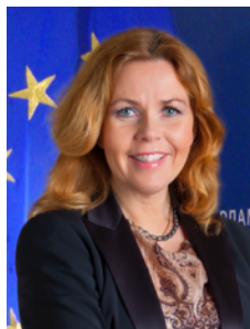
Cecilia Wikström Ledamot av Europa-parlamentet, präst, författare. Riksdagsledamot