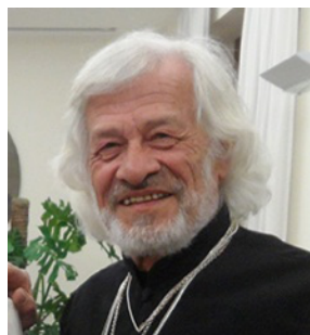
Carlos Luna Vän med Påve Franciskus, med hjälp av dennes kalott gör han en insamling för romer i Europa.