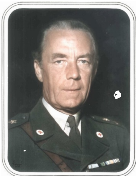
FOLKE BERNADOTTE 1895 - 1948

Allt det osannolika lidande som Folke Bernadotte och alla som deltog i operationen mötte, gjorde dem fast beslutna att rädda så många de kunde, oavsett varifrån de kom. Medlidandet gjorde att många fler räddades än som man från början trodde var möjligt. Medmänsklighet är en egenskap som gör oss till människor och som ger hopp i tider av krig och katastrofer.