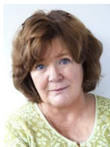
Majgull Axelsson Författare med ett 20-tal böcker i sin bibliografi. Den senaste är "Jag heter inte Miriam". Har bl a fått Augustpriset-97 och Ivar Lo-priset -15