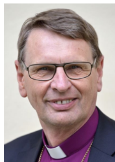
Per Eckerdal Biskop i Göteborgs stift