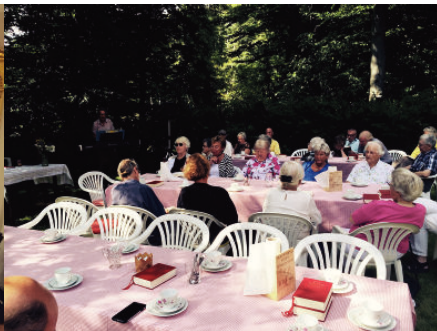
Ett säkert sommartecken är det när vi åter kan fira gudstjänst vid Ryggåsstugan i Ängalag.