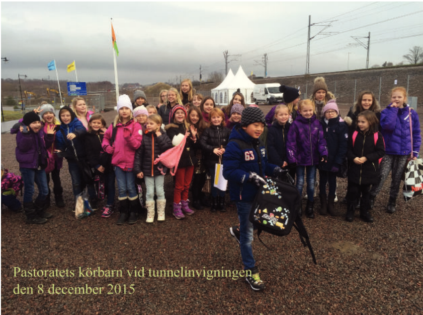
Pastoratets körbarn vid tunnelinvigningen den 8 december 2015

Biljettpris: 150:-. Köps på expeditionen eller före konserten i kyrkan. Onummerade platser.