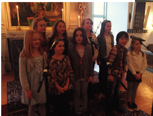
Barnkören sjöng i Västra Karups kyrka