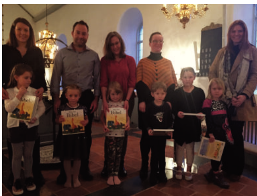
På Kyndelsmässodagen fick 6-åringarna sin barnbibel. Lycka till med era Biblar!