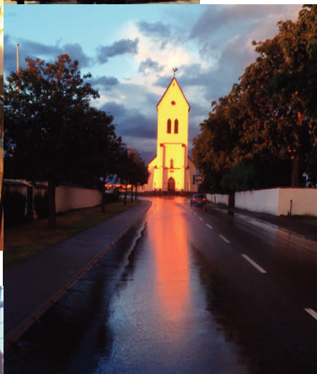
Torekovs kyrka i fantastiskt ljus