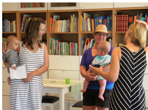
Lille Skutt, vår populära öppna förskola på tisdagar träffas tisdagar mellan kl 10 - 12.