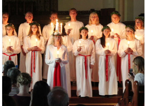
Luciakonserterna i Svenska kyrkan och Unting church drog fullt hus.