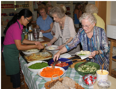
Tisdagsträffen träffas andra tisdagen i månaden för middagsandakt och en efterföljande lunch.