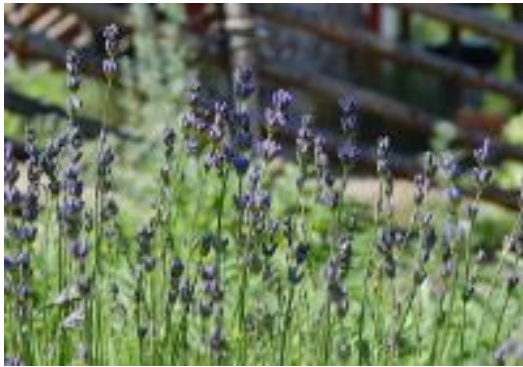
Lavendel ( Lavandula angustifolia )