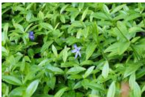
Vintergröna (Vinca minor)