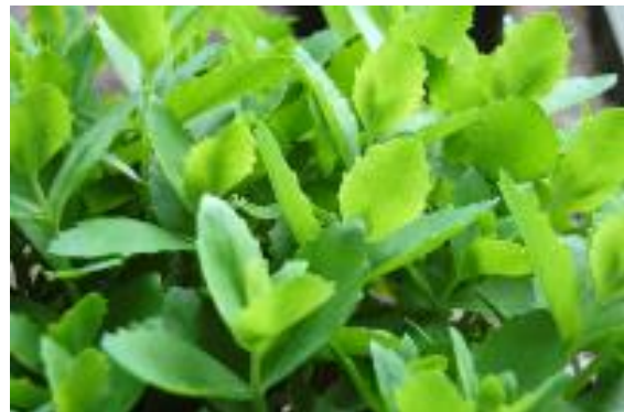
Kärleksört ( Hylotelephium telephium )