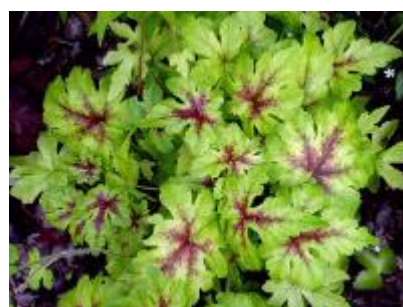
Spetsmossa ( Tiarella )