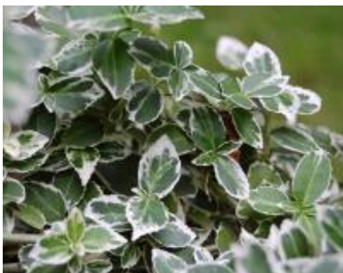
Gulbrokig benved ( Euonymus fortunei )