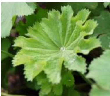
Daggkåpa ( Alchemilla vulgaris L)