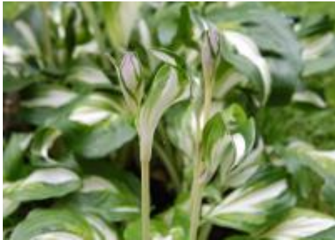
Funkia (Hosta fortunei)