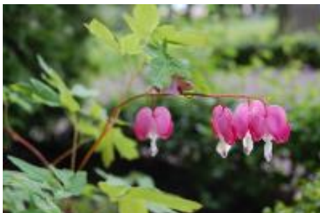
Löjtnantshjärta ( Lamprocapnos spectabilis )