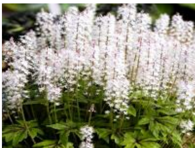
Spetsmossa ( Tiarella )