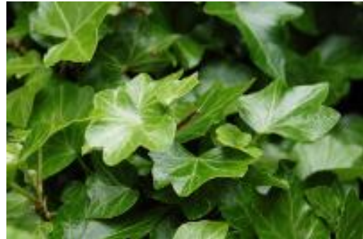
Murgröna (Hedera helix)