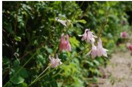
Akleja ( Aquilegia vulgaris )