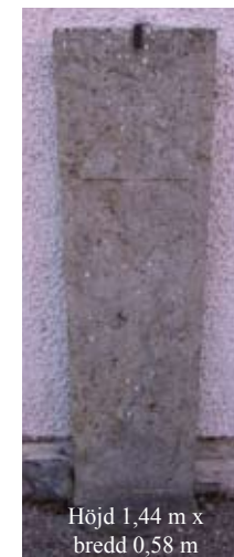
Höjd 1,44 m x bredd 0,58 m

Kyrkogården är utökad i två etapper, dels mot öster, dels mot väster. På den ursprungliga delen finns flera intressanta gravvårdar av sandsten (medeltida) och kalksten (1600-1700-tal) från Kinnekulle.