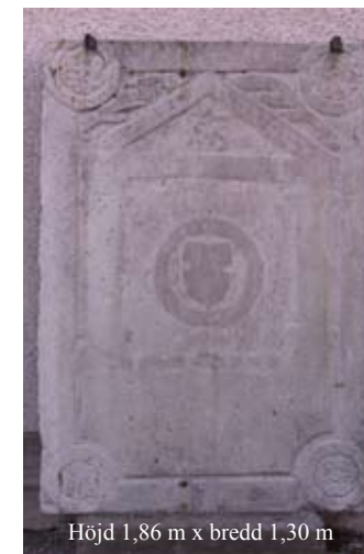
Höjd 1,86 m x bredd 1,30 m