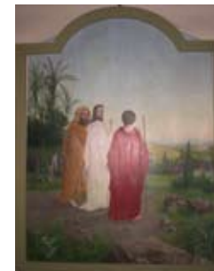
Den tidigare altartavlan föreställande Emmausvandringen.

Kyrkorgeln är gjord 1970 av Nordfors & Co, Lidköping. Den har 7 stämmor.