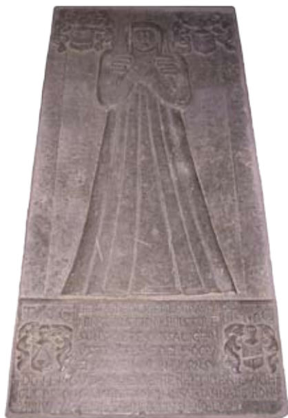
Längd 2,17 m x bredd 1,05 m

Vid restaureringen 1982 fann man under trägolvet två porträttgravhällar gjorda kring 1600.