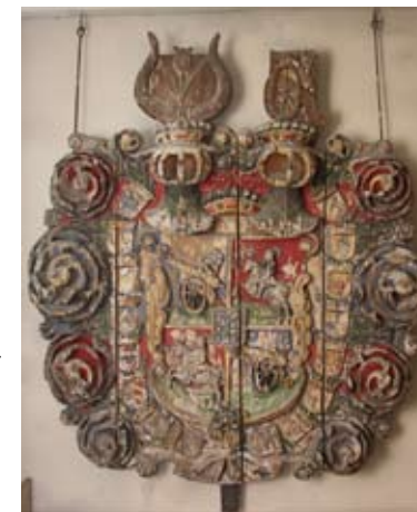
Huvudbanér med friherreätten Stakes fyrdelade vapen med hjärtsköld och två hjälmar samt 16 anvapen.

Sköldarna representerar probandens 16 anor i fjärde generationen i tur och ordning från vänster till höger.