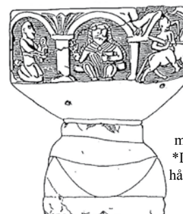
FIG. 51. VÄTTNÄS. FEB 6. 1-2.

Dopfunten har en mycket tydlig ornamentik och den anses vara ett verk av en västgötsk stenmästare från 1100-talets senare hälft.