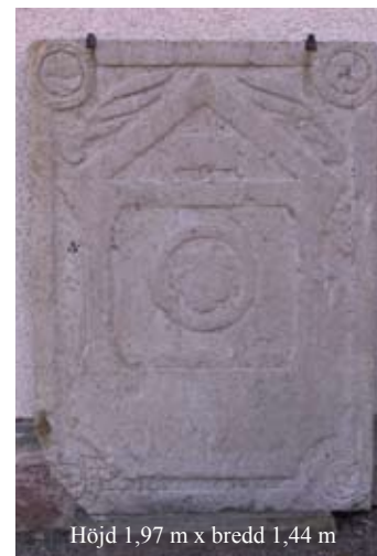
Höjd 1,97 m x bredd 1,44 m