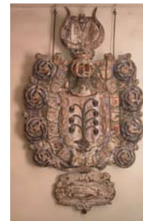
Huvudbanér med adliga ätten Stakes vapen och med 16 anvapen runt detta.

Kyrkorgeln är gjord 1970 av Nordfors & Co, Lidköping. Den har 7 stämmor.