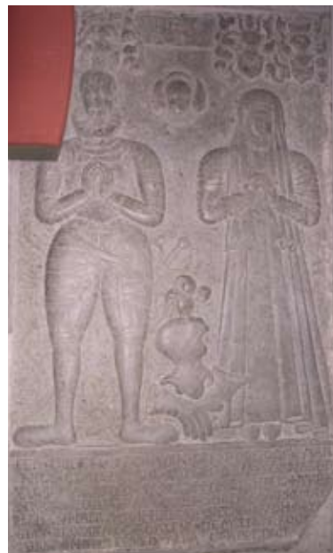
Längd 2,32 m x bredd 1,35 m

Tack vare att dessa gravhällar länge legat skyddade av trägolvet har reliefen ännu kvar mycket av sin ursprungliga skärpa.