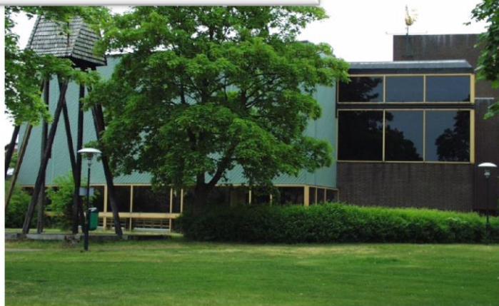
S:ta Birgitta kyrka