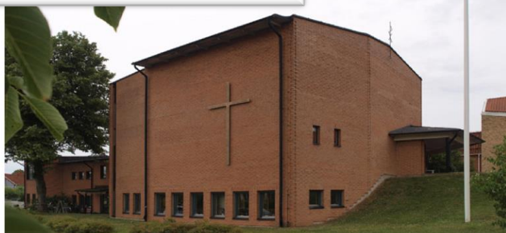
S:t Johannes kyrka