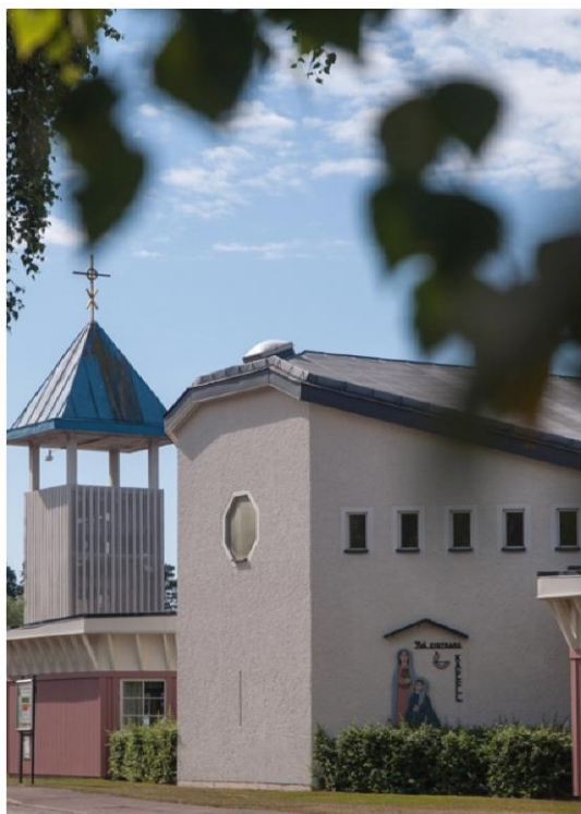
Två Systrars kapell