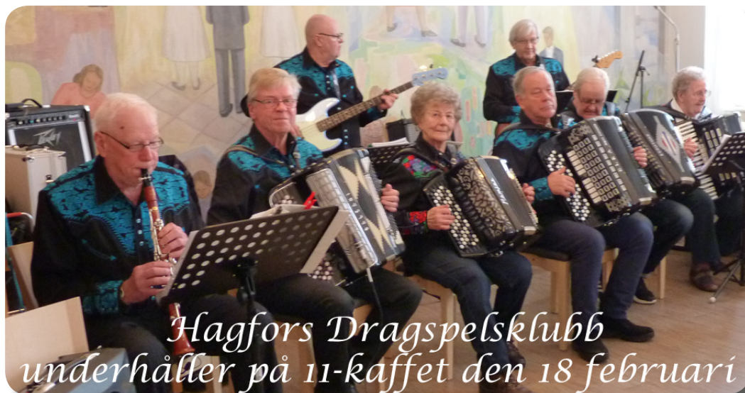
Hagfors Dragspelsklubb underhåller på 11-kaffet den 18 februari