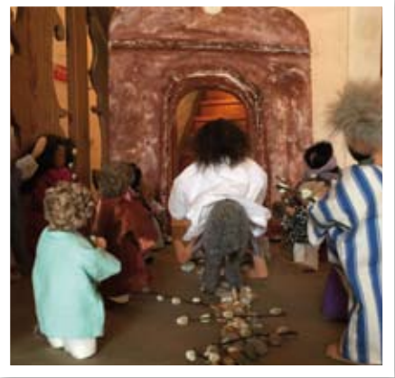
Intåget i Jerusalem.

Emmausvandring kl 15.00 med efterföljande mässa i Skånörs kyrka. Vandringen utgår även från Skånörs kyrka.