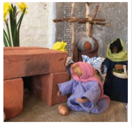
Maria, Maria från Magdala och Salome vid graven.