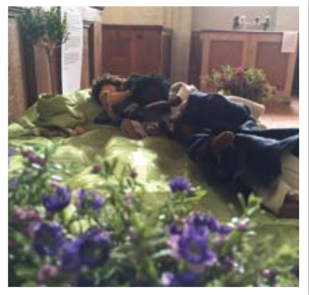
Lärjungarna Petrus, Jakob och Johannes i Getsemane.