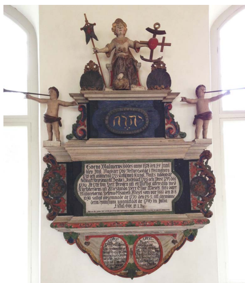
BEGRAVNINGSVAPEN: SVENO MALMERUS 1770