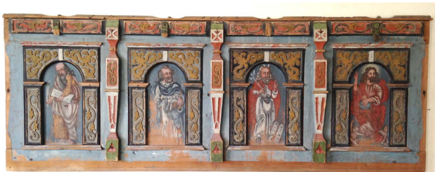
DEN ENA LÄKTARBARRIÄRENS BILDER.