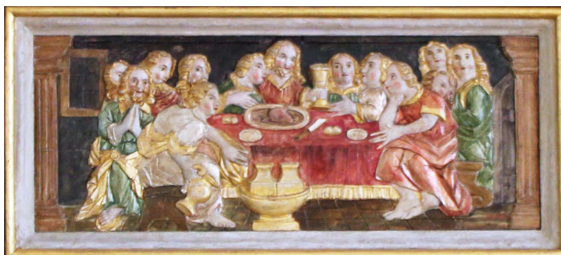
NATTVARDENS MÅLTID, DEL AV ALTARUPPSATSEN

Över altaret finns en rundbåge med inskriften: ”Si Jag Är När Eder Alla Dagar Intill Verldens Ände Math: 28:20” Inskrift från renoveringen 1896.