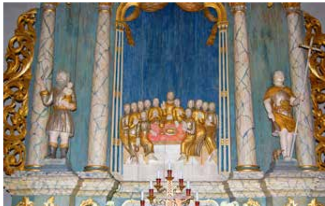
Altartavlans nedre del med nattvarden.

Beslutet från 1767 om att bygga en ny kyrka på Bjärnskullen föregicks av protester och överklagande från "ovan-skogarna" som istället ville bygga på Karlandamon. Den 19 maj 1776 avtog slutligen Kunglige Maj:t deras överklagande och kyrkan i Bjärn kunde börja byggas för att stå färdig 1778. Kyrkans murar är vitputsade såväl ut- som invändigt och genombryts av rundbågiga fönsteröppningar. Exteriören förändrades i vissa delar under 1800-talets första hälft då spåntaket byttes ut mot skiffer och tornet fick en ny överbyggnad. Kyrkorummets nuvarande interiör är i huvudsak ett resultat av 1960 års restaurering, då bland annat den ursprungliga färgsättningen på altartavla och predikstol återskapades. En del virke från den gamla kyrkan togs tillvara när den revs 1777. Bräder med fragment av takmålningar finns bevarade i kyrkan.