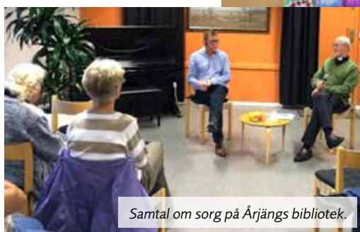
Samtal om sorg på Årjängs bibliotek.

Varmt TACK till alla som gjorde det möjligt.