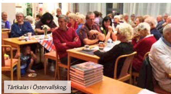
Tårtkalas i Östervallskog.