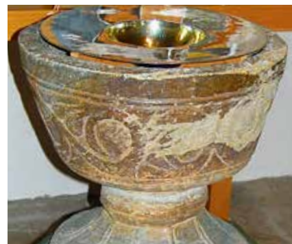
Dopfunten från 1200-talet.

Dopfunten av täljsten, från 1200-talet, är från den gamla kyrkan i Stommen. Själva cuppan är prydd med slingor av medelhavsörten akantus, ett vanligt ornamentmotiv redan under antiken. Själva dopskålen i silver är skänkt 1940 till minne av Ingeborg och Nils Andersson, Mohn, Gillberga. Täljstenen i dopfunten är troligtvis från Norge medan ornamenten med akantusrankorna ger anledning att vända blickarna mot Västergötland. En intressant blandning av öst och väst som smälter samman i Värmlands medeltida konst. Över dopfunten hänger en ljuskrona från 1737.