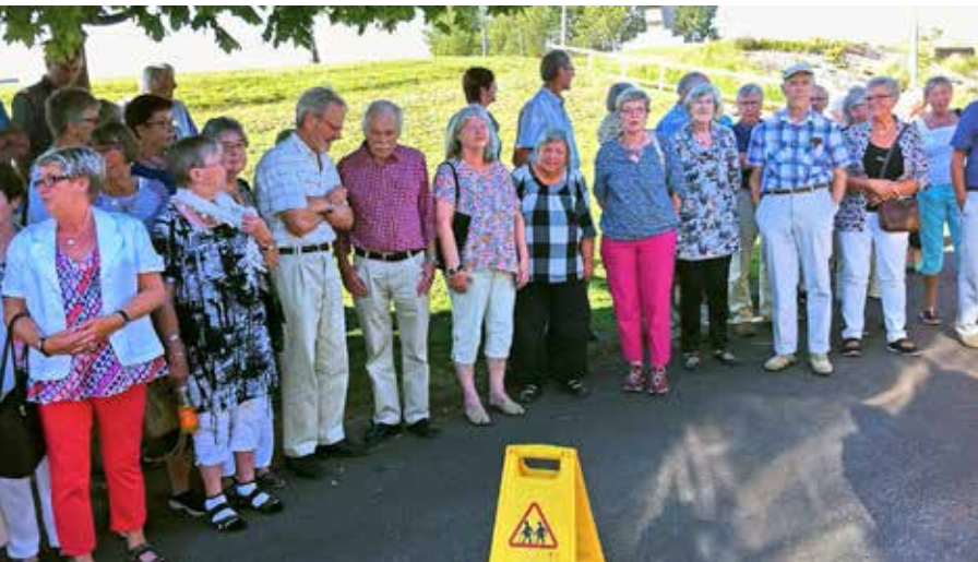
SILLERUDSBOR PÅ TUR Församlingsresan gick Frykensäarna runt i augusti. Kafferast vid Nilsbybron och lunch på Sahlströmsgården där vi lyssnade på ett föredrag om gårdens historia. På hemvägen kaffepaus vid Stamfrändemonumentet vid Rottneros.