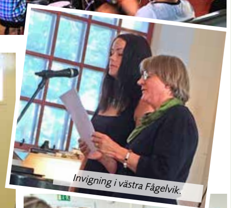
Invigning i västra Fågelvik.