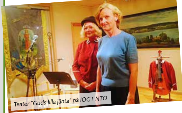
Teater "Guds lilla jänsta" på IOGT NTO