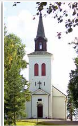
VÄSTRA FÅGELVIKS KYRKA