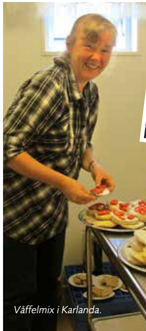
Väffelmix i Karlanda.