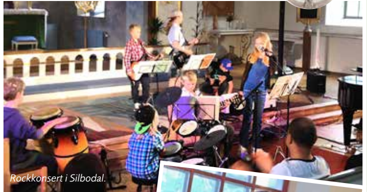
Rockkonsert i Silbodal.

Några bilder som visar lite av alla aktiviteter under Diakonins månad.