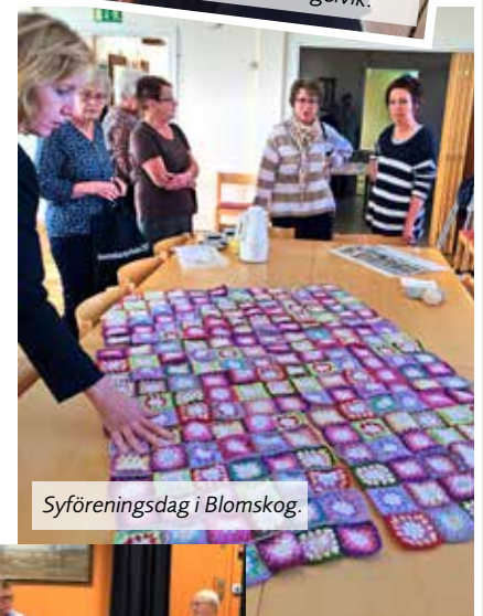
Sy föreningsdag i Blomskog.