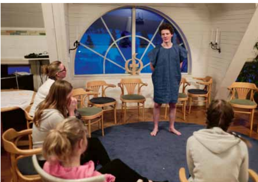
Petrus berättar om sin tid med Jesus i påskvandringen