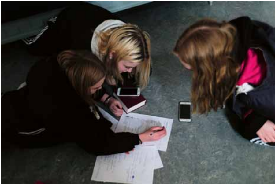
Konfirmanderna letar svar till "50 frågor" i Bibeln och med Google.