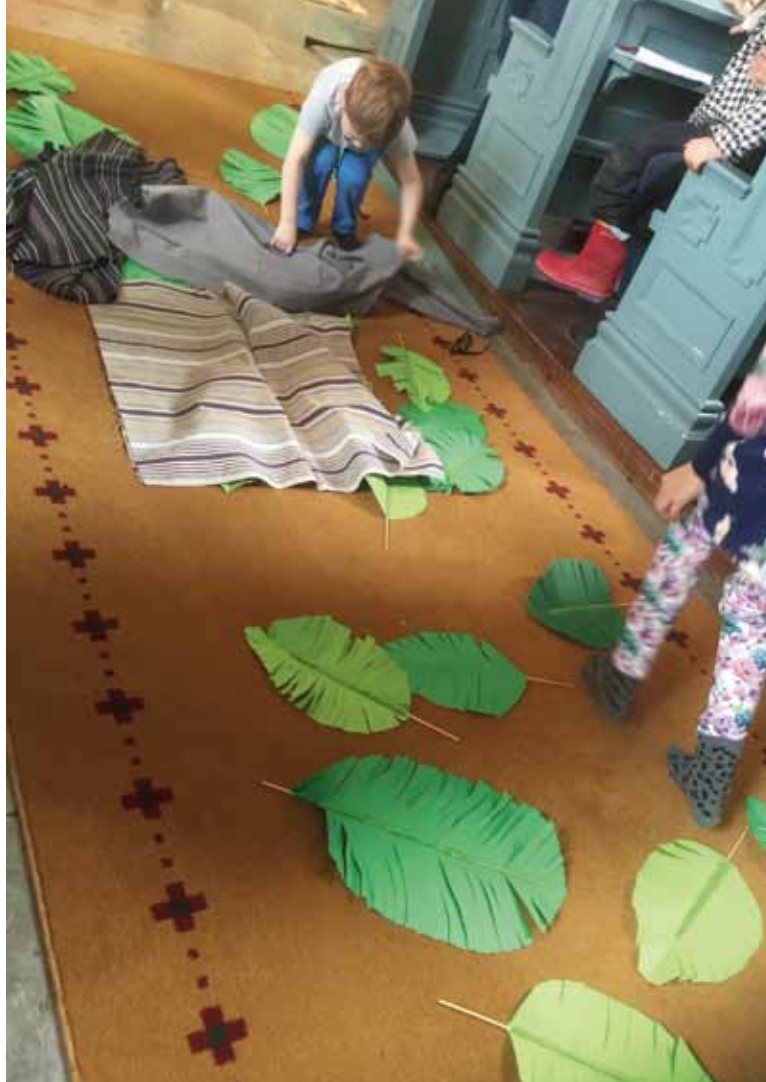
Palmsöndag i Lena kyrka.