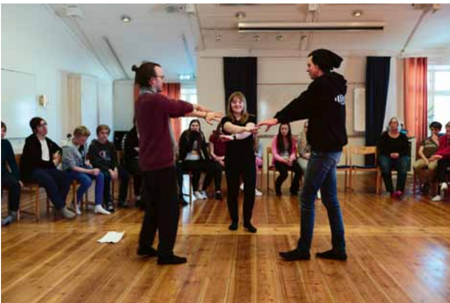
Unga ledare leder lekar.