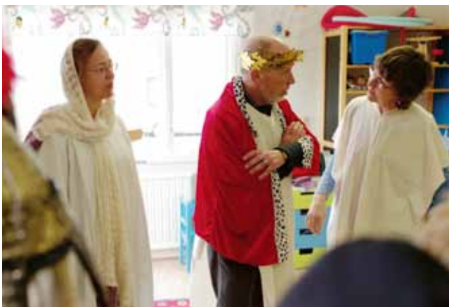
Jesus inför Pontus Pilatus och översteprästen Kaifas.

Annandag pingst 16 maj blir det middag och mässa i Kyrkans hus. Maten serveras kl 18, mässan börjar kl 19. Alla barn är välkomna från kl 17 för att leka!