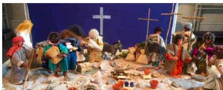
Påskbordet i Lena kyrka