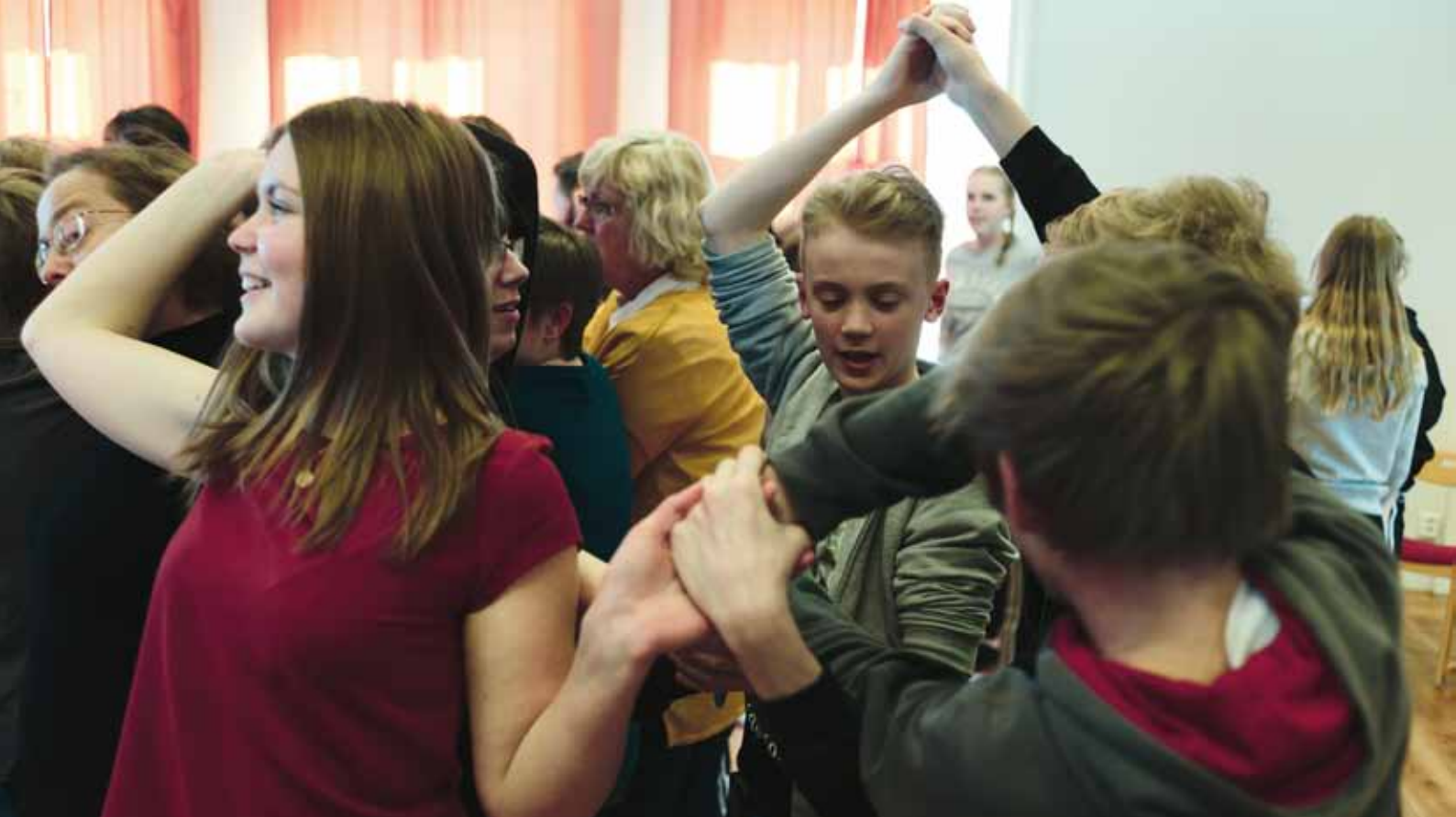
Konfirmander och ledare trasslar ut sig i leken "knoten".