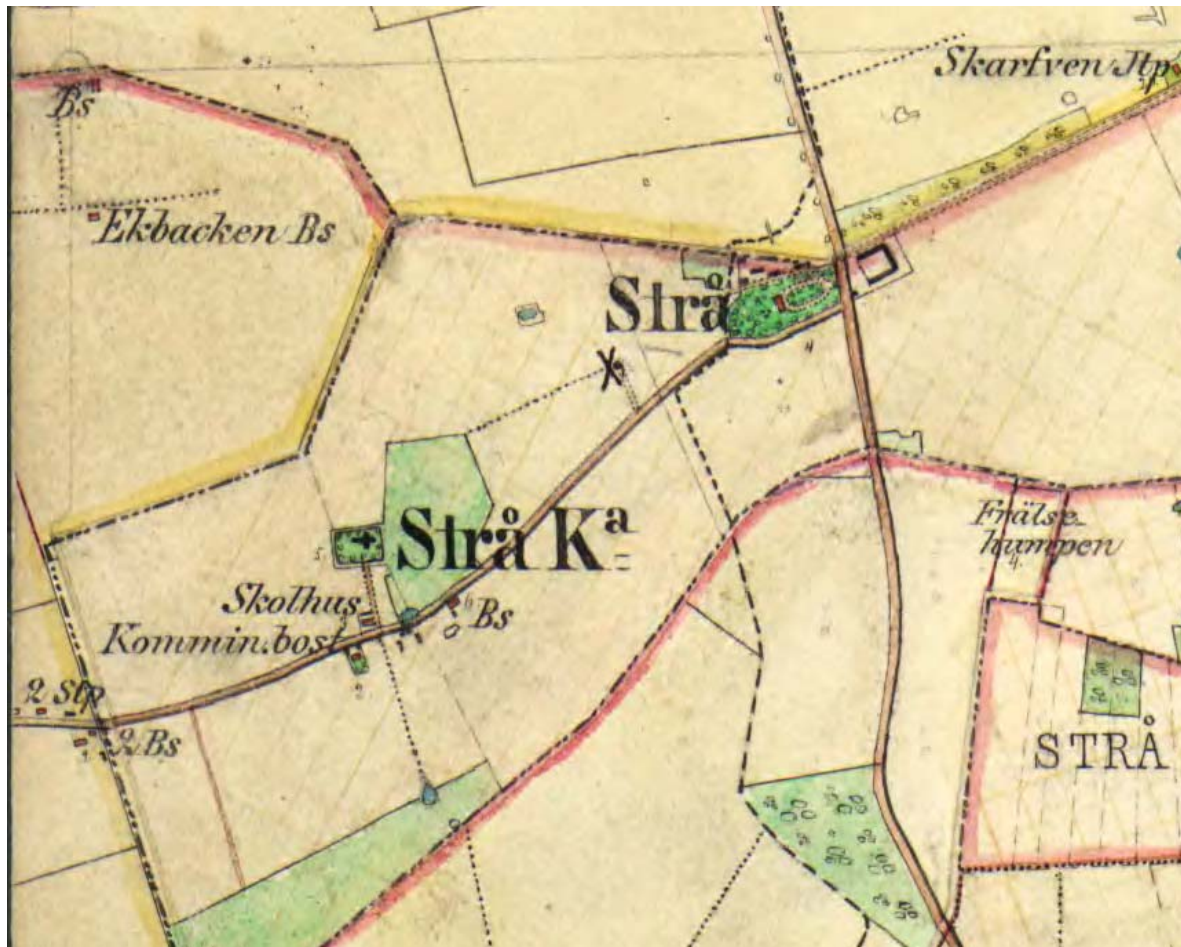
Utsnitt ur häradsekonomisk karta 1868-1877, Orlunda

huvudnäringen. Väderkvarnar har varit vanliga på den öppna blåsiga slätten. I socknen har det funnits flera säterier, bl a Kalvestad, Mjölna och Åby eller Åbylund.