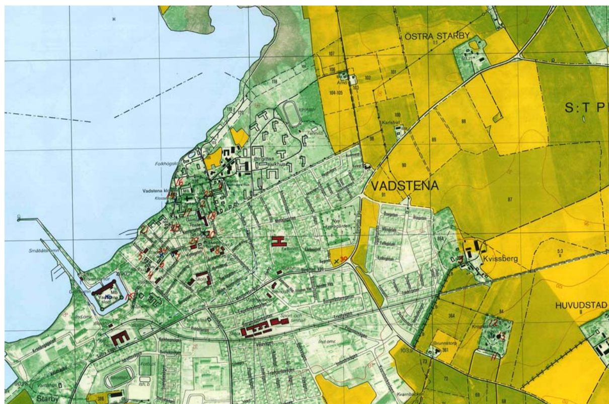
Utdrag ur ekonomisk karta 1983, blad 8E 6j Vadstena