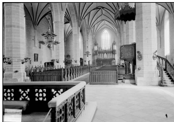
Vadstena klosterkyrka ca 1900-1910.

Den närbelägna S:t Pers kyrka krävde i slutet av 1700-talet genomgripande reparationer och man beslöt att istället flytta över församlingsverksamheten till klosterkyrkan. Klosterkyrkan genomgick en omfattande renovering och invigdes för sitt nya ändamål 1829. En ny huvudingång hade tagits upp i väster och högaltaret fick ge plats för en orgel. Klosterkyrkan hade inte tidigare någon orgel. Anledningen var att Birgitta uttryckligen föreskrev att orgel inte fick förekomma i hennes orden. Först på 1820-talet när klosterkyrkan skulle förvandlas till ordinarie församlingskyrka aktualiserades orgelfrågan. År 1833 stod en orgel färdig byggd