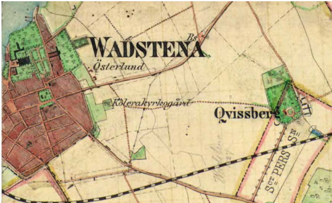
Utdrag ur häradsekonisk karta 1868-1877, Orlunda