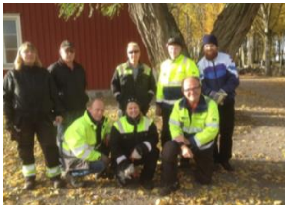
Tjugofem medarbetare sköter Kalmars begravningsplatser, på bilden syns personalen på Södra kyrkogården.

Begravningsplatserna omfattar en sammantagen yta av omkring 22 ha och till detta kommer ett mindre antal ekonomibygnader och krematorium samt lokal för begravningsceremonier utan religiösa symboler.