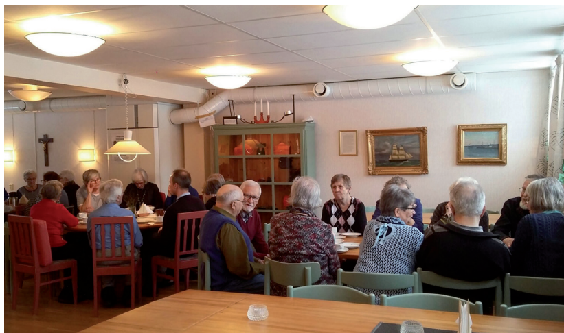
Cafe' Ankaret - ett cafe' i centrum av Ursviken - är ett samarbete mellan EFS och PRO.

Under rubriken Backspegeln får du veta en del av det som har hänt under de senaste månaderna.