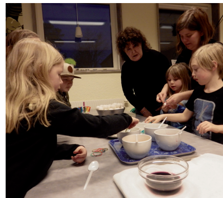
Messy Church i S:t Örjansgården. En samling för att förbereda påskan. Här målar man påskägg.