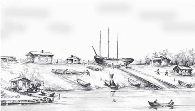
Så kan Alderholmens varv ha sett ut på 1870-talet. Akvarell av Bertil Andersson.