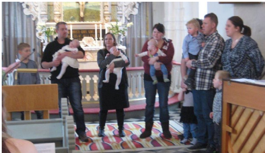
Ängloutdelning Västra Torup.