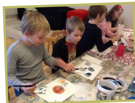
Akvarellmålning på fritidshemmet. Under juni månad kommer Stjärnan att ha en utställning på Biblioteket, välkomna att se på vår alster.