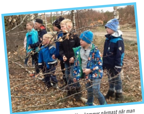
Barnen på fritids trivs utomhus. Vem kommer närmast när man kastar sin äppelskrutt?

Text och bild: personal från Stjärnans förskola och fritidshem.