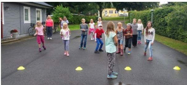
Barn från Sommarkyrkan 2015

Årets Sommarkyrka för barn går av stapeln tisdag till fredag i vecka 33. Är du född 2005-2008 så kommer du att få en inbjudan i vecka 23 hem i din brevlåda. Undrar du något redan nu så maila till barnsvenskakyrkantyringe@gmail.com