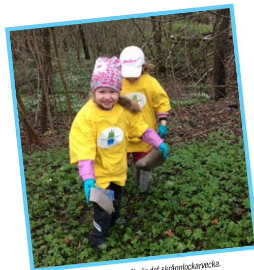
Här tar vi vårt samhällsansvar. Nu är det skräpplockarvecka. Och oj så mycket vi hittade...