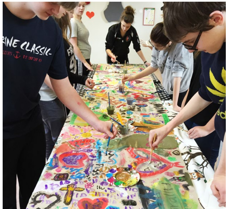
Konfirmander visar sin kreativa förmåga.