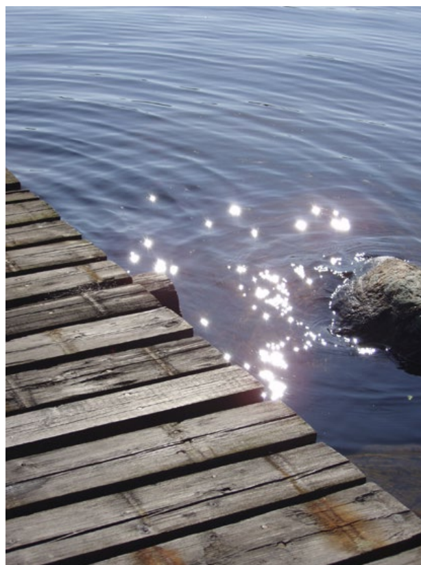
Självlkart har vi beställt fint väder för alla sommarens evenemang!

Det kommer att börja med en kort gudstjänst, därefter blir det korvgrillning och aktiviteter för hela familjen. Medtag något att sitta på.