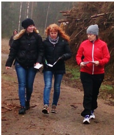
Livsloppet avslutade fasteinsamlingen i Röke.