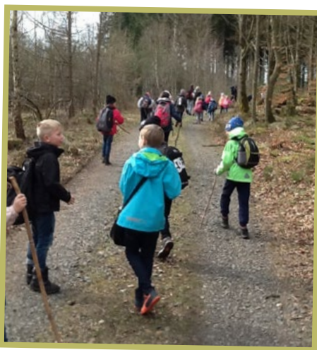
Är det studiedag på skolan så finns det tid och utrymme för en heldag i skogen med långvandring.