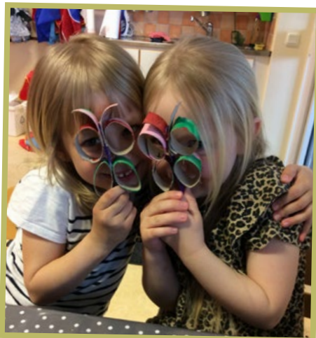
Titta fjärlen blev till glasögon.