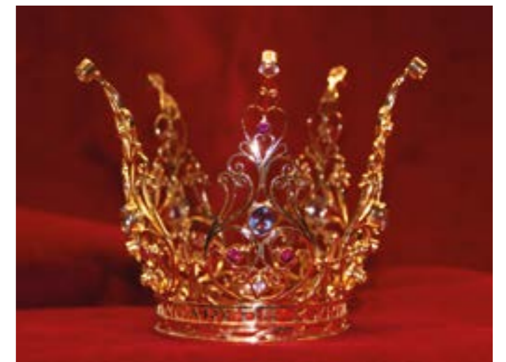
Brudkrona i Långareds kyrka

Hade vi varit ett säljföretag hade vi stolt proklamerat: VI KAN DET HÄR MED BRÖLLOP!!!! Men eftersom vi är din lokala församling säger vi bara i all enkelhet: Till oss är ni välkomna att samtala och rådfråga om musik, utformning av vigselakt och annat som man kan fundera över inför ett av de viktigaste besluten i livet. Vi vill gärna vara med på ett hörn. Vi vill gärna sponsra allt som har med kärlek att göra. Välkommen att höra av dig till Bjärke församling.