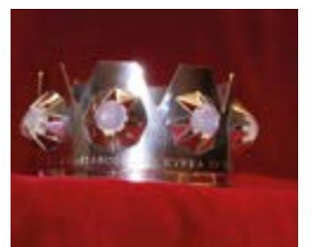
Brudkrona i Lagnmansereds kyrka