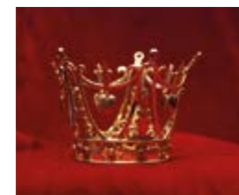
Brudkrona i Stora Mellby kyrka