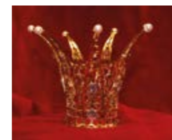
Brudkrona i Erska kyrka