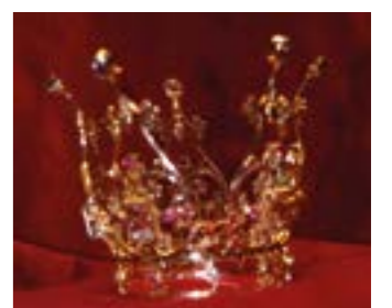
Brudkrona i Magra kyrka