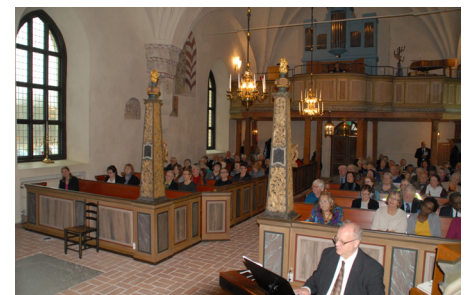
Enåkers kyrka var full under den första gudstjänsten på två år.

Renoveringsarbetet blev klart några dagar innan kyrkan skulle återinvigas.