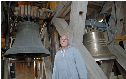
Mellanklockan och lillklockan Gloria.