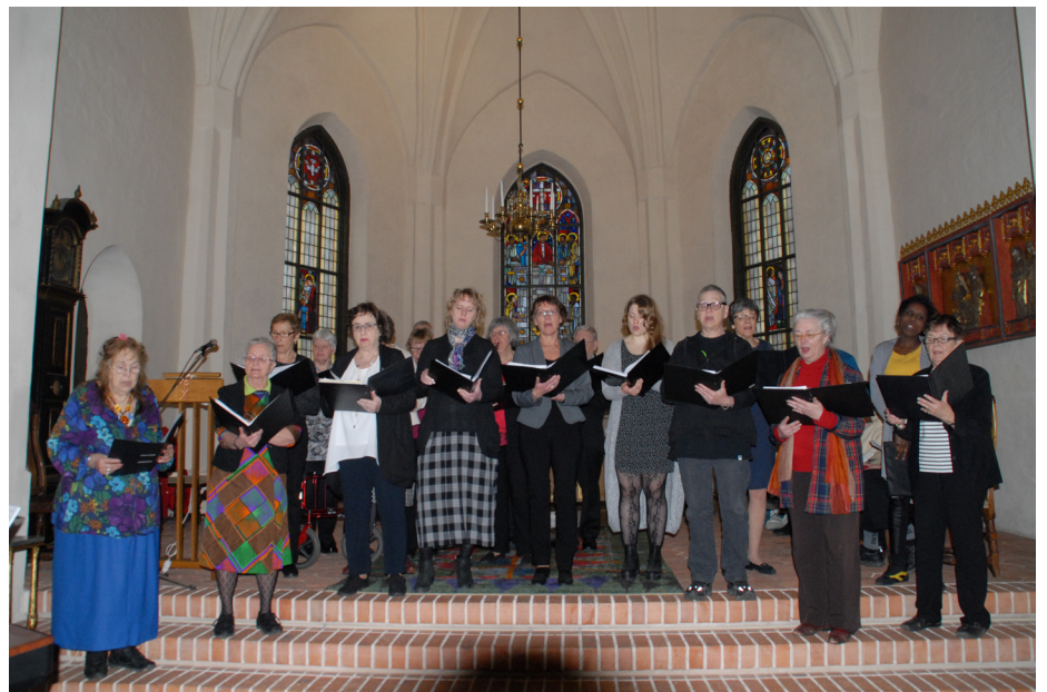
Västerlövsta och Huddunge kyrkokörer tillsammans i Enåkers kyrka den 29 mars.

Enåkers kyrka har sedan hösten 2013 genomgått en stor renovering.