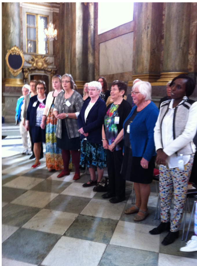
Västerlovsta kyrkokör tillsammans med medlemmar ur Huddunge kyrkokör sjöng i Slottskyrkan 26 april.

Anmäl ditt intresse till pastoratsexpeditionen: 0224-341 90 eller vasterlovsta.pastorat@svenskakyrkan.se Välkommen!