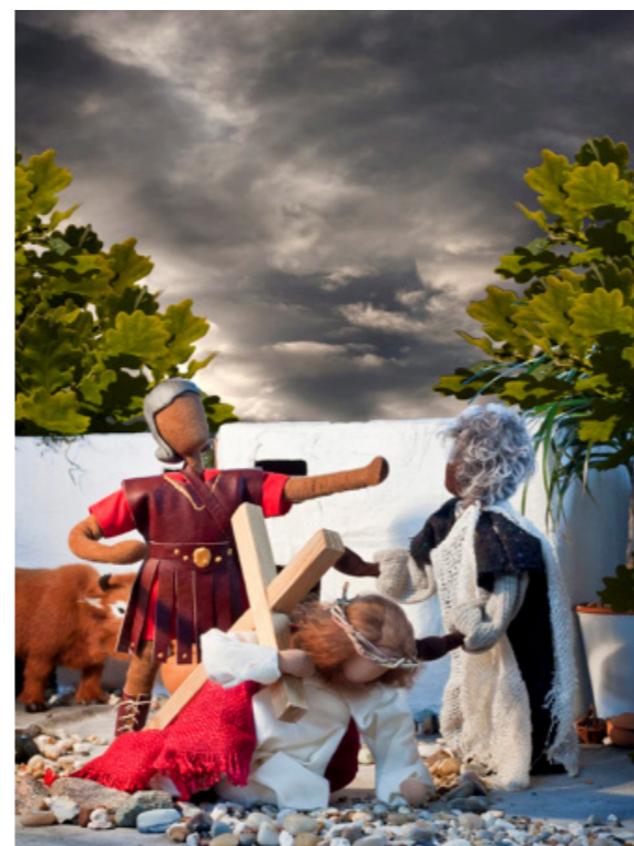
Påskberättelsen är full av dramatik.