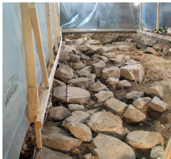
Grundmuren efter en äldre kyrka, under golvet i Enåkers kyrka. Foto mot koret av Anna Ölund

till 900-talets senare del vilket visar att platsen har varit använd även under vikingatid. Resultaten är spännande och gör att kunskapsläget kring områdets medeltida historia delvis förändras.