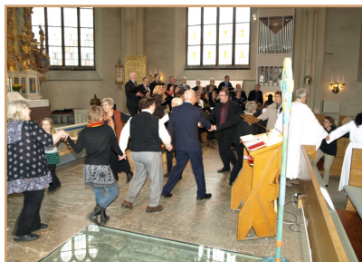
Hela kyrkan dansar långdans!