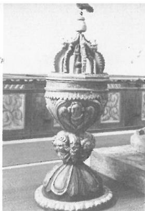
Dopfunten av snidat trä skänkt till kyrkan 1730.