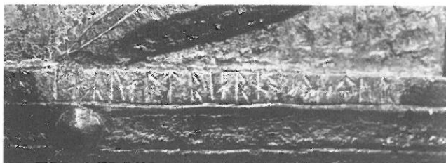
Detalj från sakristidörrens smidesbeslag med dess runinskrift.