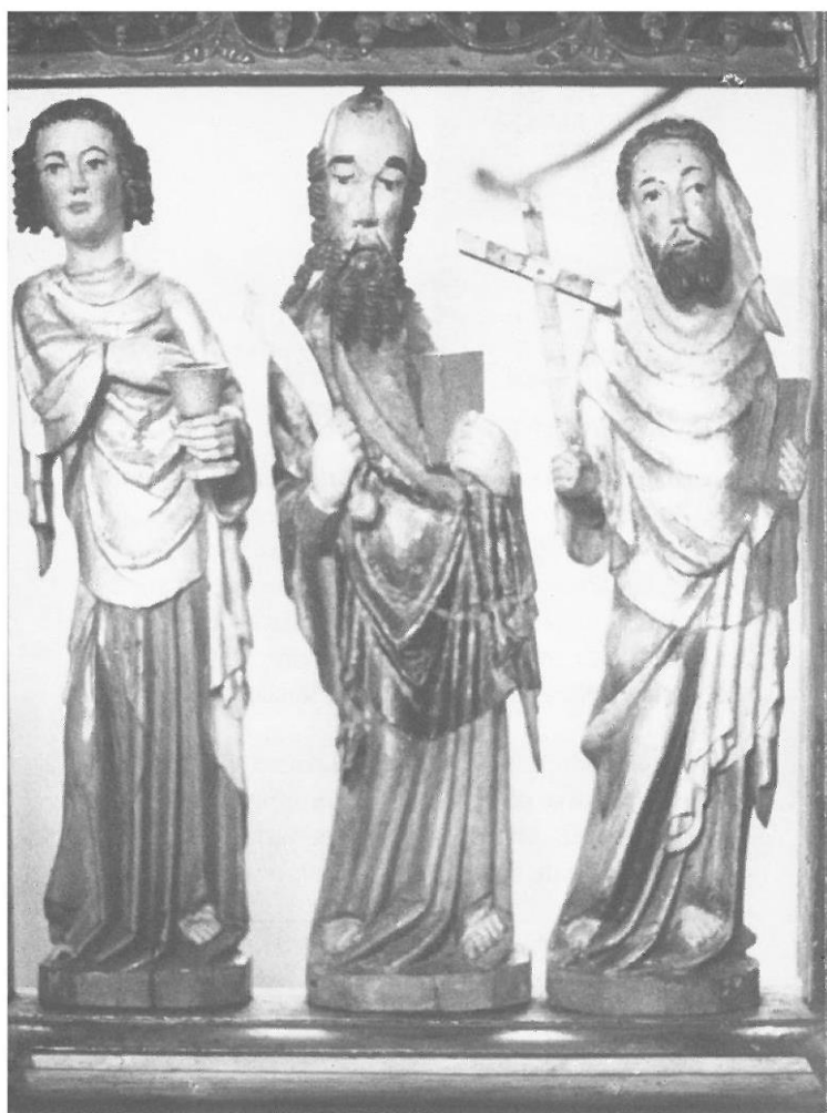
Detalj av altaruppsatsen med tre av träskulpturerna som tidigare tillhört kyrkans medeltida altarskåp.