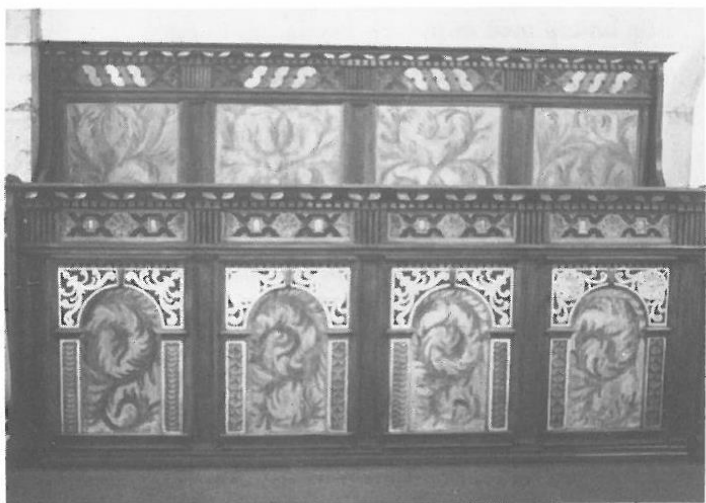
Korbänk från 1600-talets slut troligen tillverkad av Jochim Sterling.

1979–80 genomgick kyrkan en omfattande inre och yttre restaurering efter förslag av arkitekten Arne Philip, Visby.