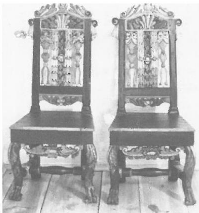
Rikt snidade brudstolar av ek från 1730, tillkom samtidigt som dopfunten.