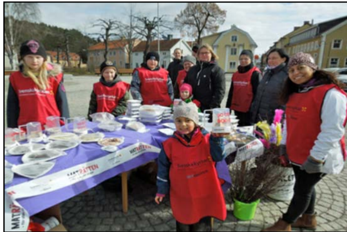
Brödförsäljning på Hagatorget i Söderköping.