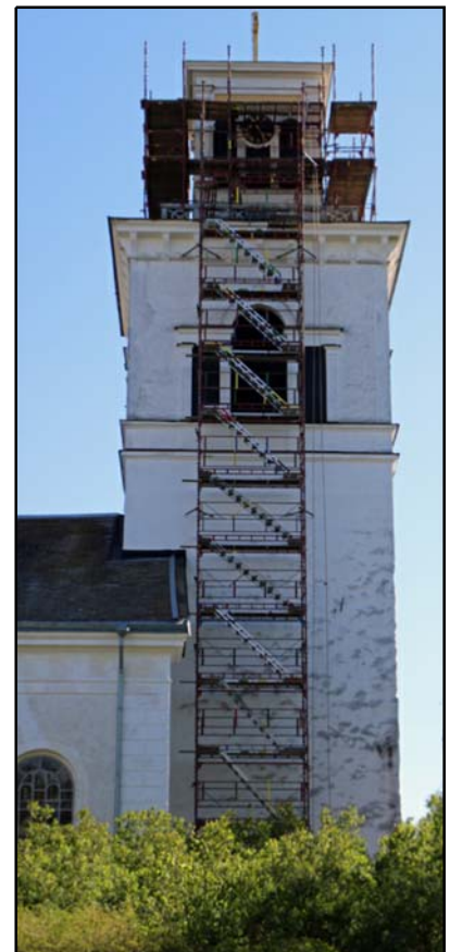
Mogata kyrkas tornhuv under renovering.

Annica Frank Wastesson Fastighetsförvaltare