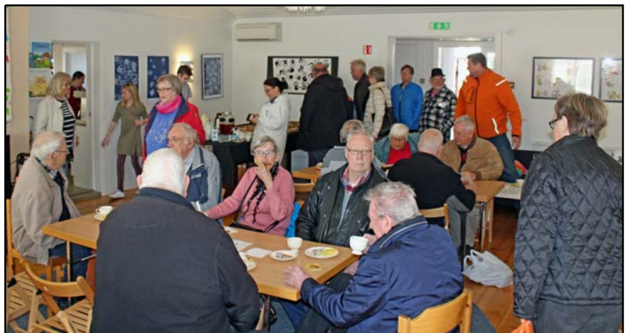
I Tingshuset var det tidvis kö till kaffet och ont om plats vid kaffeborden

Bild nedan: Söndag 1 maj i Skönberga kyrka sjöng Glädjekören vid gudstjänsten. Bild till höger: Vid gudstjänsten söndag 17 april i Börrums kyrka sjöng två gästande stipendiater från Tanzania traditionella sånger därifrån a capella.