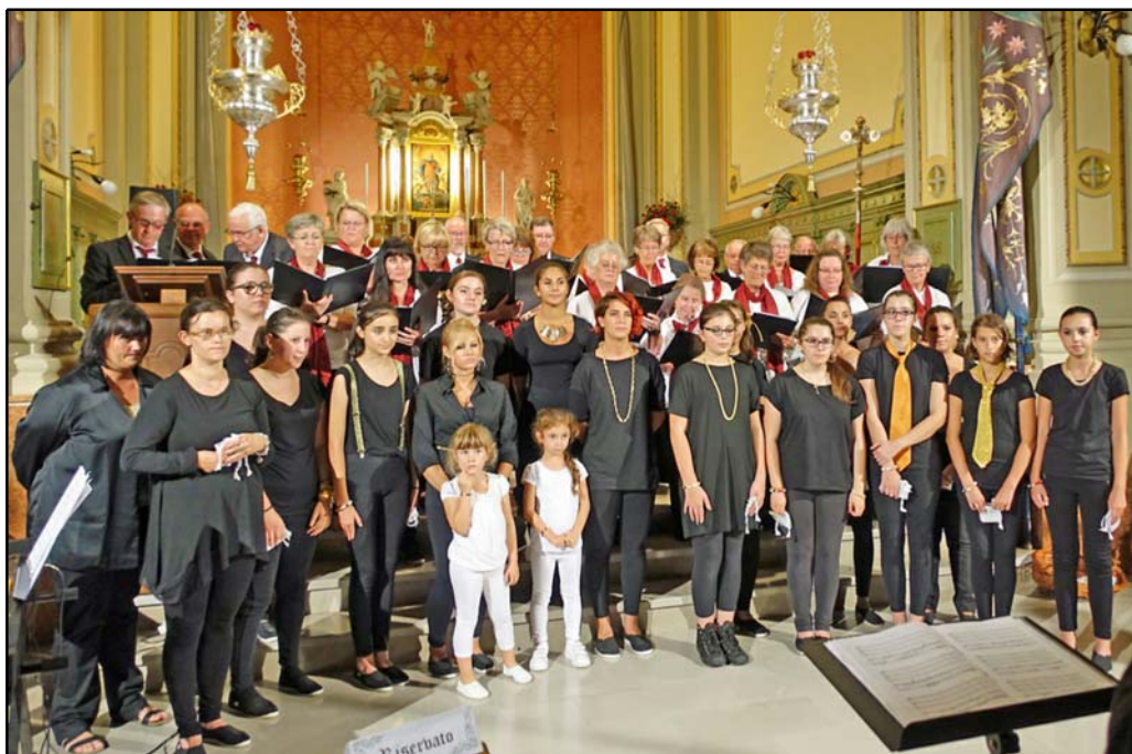
Coro le Viole och S:t Laurentii kyrkokör i Torsa, Italien, lördagen den 19 september 2015.