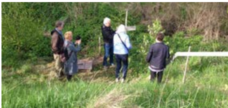
Årets källdrickning i Säby, Vittinge. Hembygdsföreningen är arrangörer, men Vittinge kyrkokör är alltid där och sjunger.