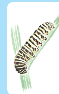
Larven lever främst på kärresilja och kvanne men även på andra flockblommiga arter.