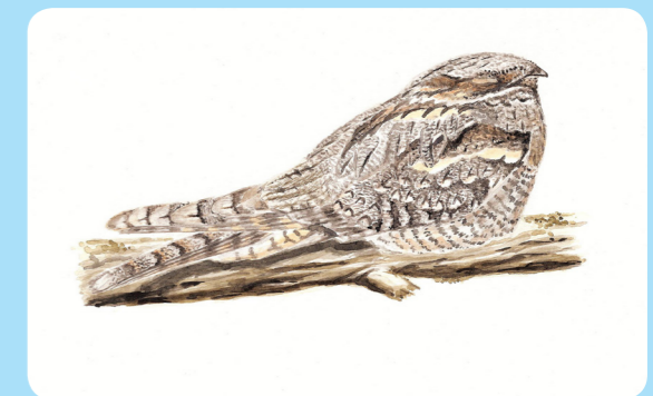
Nattskärnan häckar på marken. Häckning har observerats i den glesa tallskogen i mossens norra del. Den vattrade kamouflagefärgen gör den nästan helt omöjlig att upptäcka på marken.