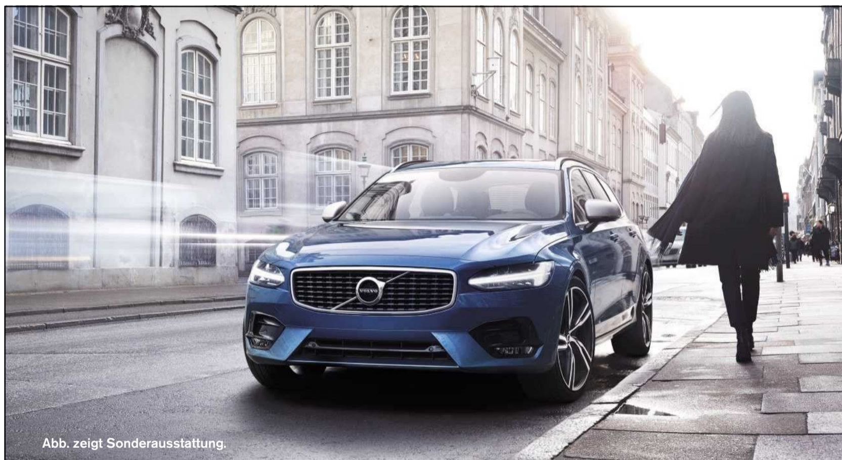
Abb. zeigt Sonderausstattung.

16365 in Schweden gebaute Autos werden laut Statistikamt Nord (Stand 2014) von Hamburgern gefahren, davon 13993 »Volvo« und 2372 »Saab«.