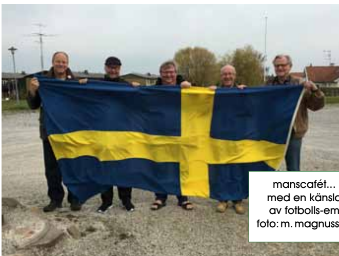
manscafé... med en känsla av fotbolls-em