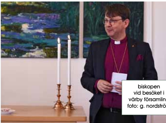
biskopen vid besöket i värby församling