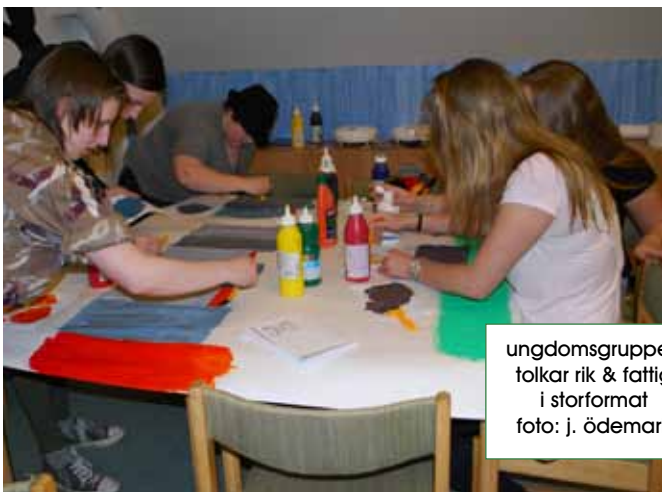
ungdomsgruppen folkar rik & fattig i storformat