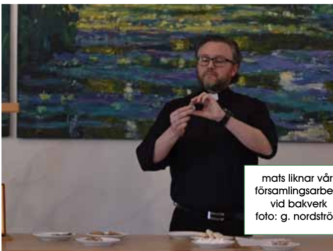
mats liknar vårt församlingsarbete vid bakverk