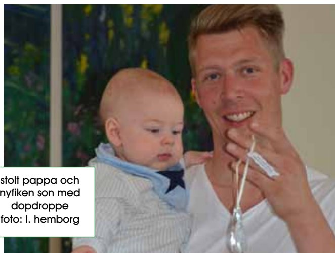
stolt pappa och nyfiken son med dopdroppe