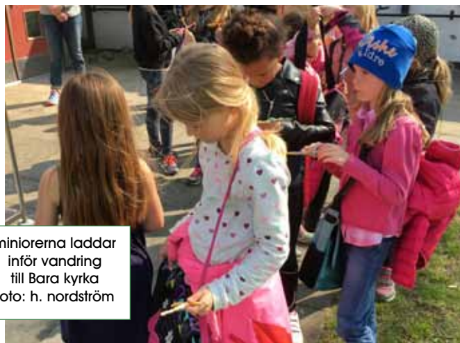
miniorena laddar inför vandring till Bara kyrka