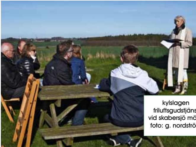
kylslagen friluftsgudstjänst vid skabersjö mölla