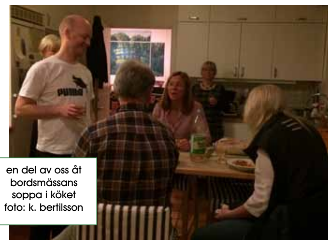
en del av oss åt bordsmässans soppa i köket