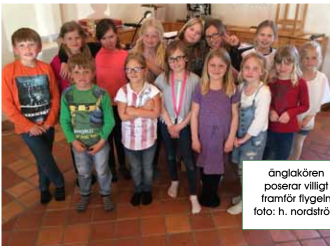
änglakören poserar villigt framför flygeln