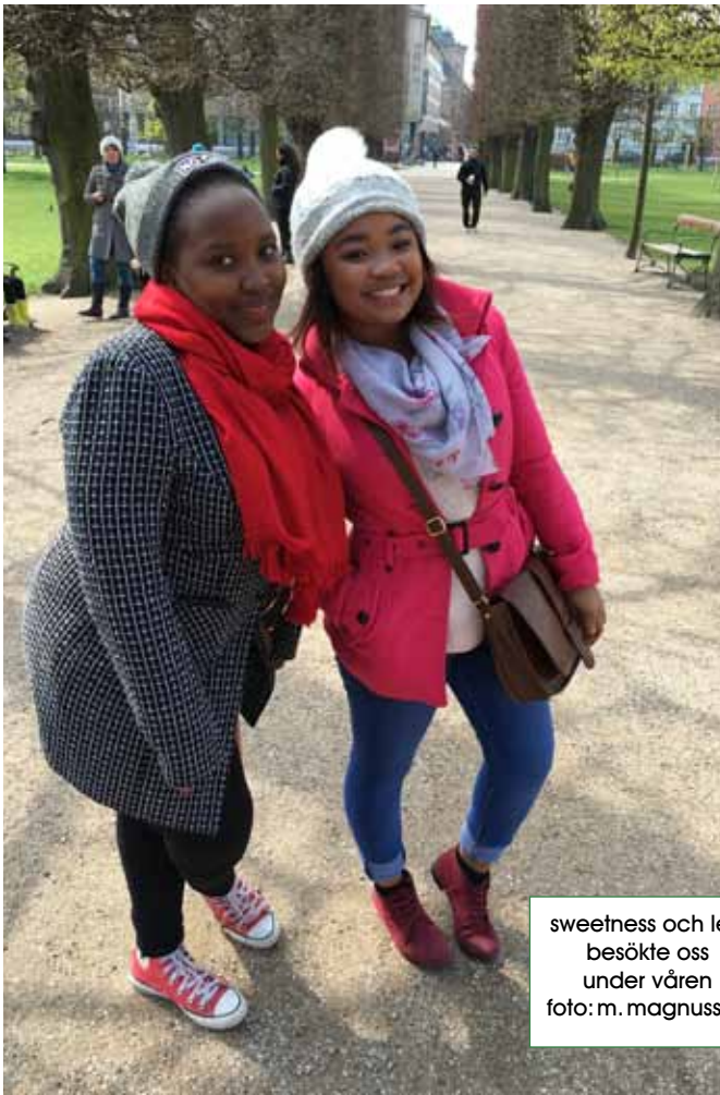
sweetness och lexi besökte oss under våren