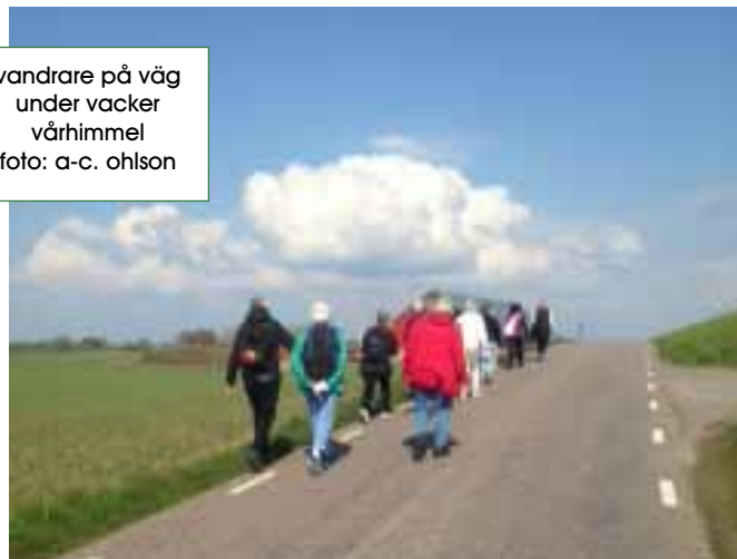
vandrare på väg under vacker vårhimmel