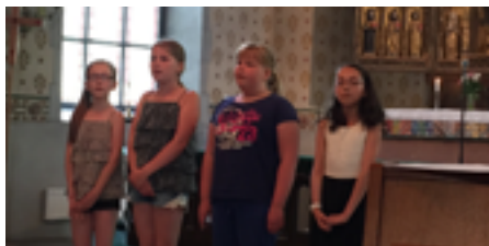
Sommaravslutning med Flickkören

Församlingen erbjuder miniminatorer för barn 4-6 år, miniorer 6-8 år och juniorer 9-13 år. Här finns möjlighet att skratta, leka, pyssla och prata om livets stora och små frågor.