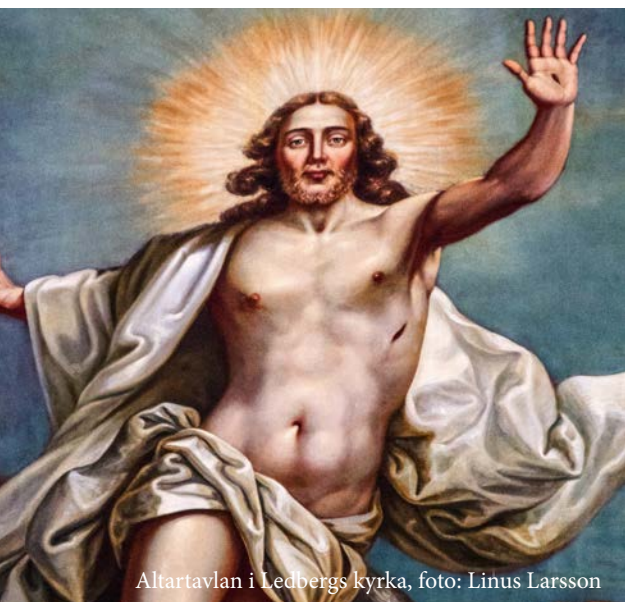
Altartavlan i Ledbergs kyrka, foto: Linus Larsson

Både Kaga, Ledberg och landsbygdsområdena kring Malmslätt har sedan sekler utmärkt sig som genuina jordbruksbygder och hör till Östergötlands bördigare områden, där större delen av befolkningen arbetade inom jordbruket. Bilden av det gamla bondesamhället har genomgripande förändrats under de senaste decennierna. Många tidigare självständiga gårdar har genom köp eller arrenden gått upp i större enheter, som med avancerad maskinteknik idag drivs med små personella insatser. Antalet yrkesverksamma i lantbruket har därför minskat successivt. Däremot har befolkningen som helhet ökat något i Kaga och Ledberg under senare år genom inflyttning, framför allt i områdena Kränge och Sättuna, som blivit attraktiva områden i en landsbygdsmiljö nära Linköpings centrum.