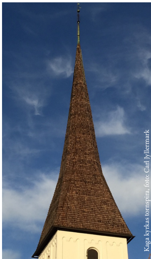
Kaga kyrkas tornspira

Vi har valt att använda oss av begreppet samvärld. Detta för att betona att församlingen inte är någon avskild enhet som står utanför och betraktar eller håller sig instängd och tittar ut. Församlingen är en del av det samhälle vi lever i, människorna utgör församlingen tillsammans, alla medlemmar, alla döpta, alla som är bärare på olika sätt. Vi har haft för avsikt att våga se verkligheten, ställa relevanta frågor samt forma mål och strategier därefter. Det finns alltid en risk att ett inomkyrkligt perspektiv, vanans makt och att man ser det man önskar se förblindar, därför har vi arbetat med en s.k. SWOT-analys, där vi som en del av samvärldsanalysen fokuserat på församlingens styrkor, svagheter, möjligheter och utmaningar att nå ut med evangeliet, fira gudstjänst och bedriva verksamhet (se bilaga 3). Slutsatserna av samvärldsanalysen och vägar framåt sammanfattas under utmaningar och prioriteringar i slutet av församlingsinstruktionen.