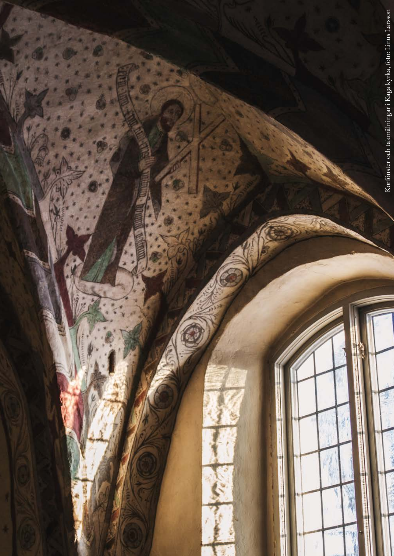
Korfenster och takmålningar i Kaga kyrka