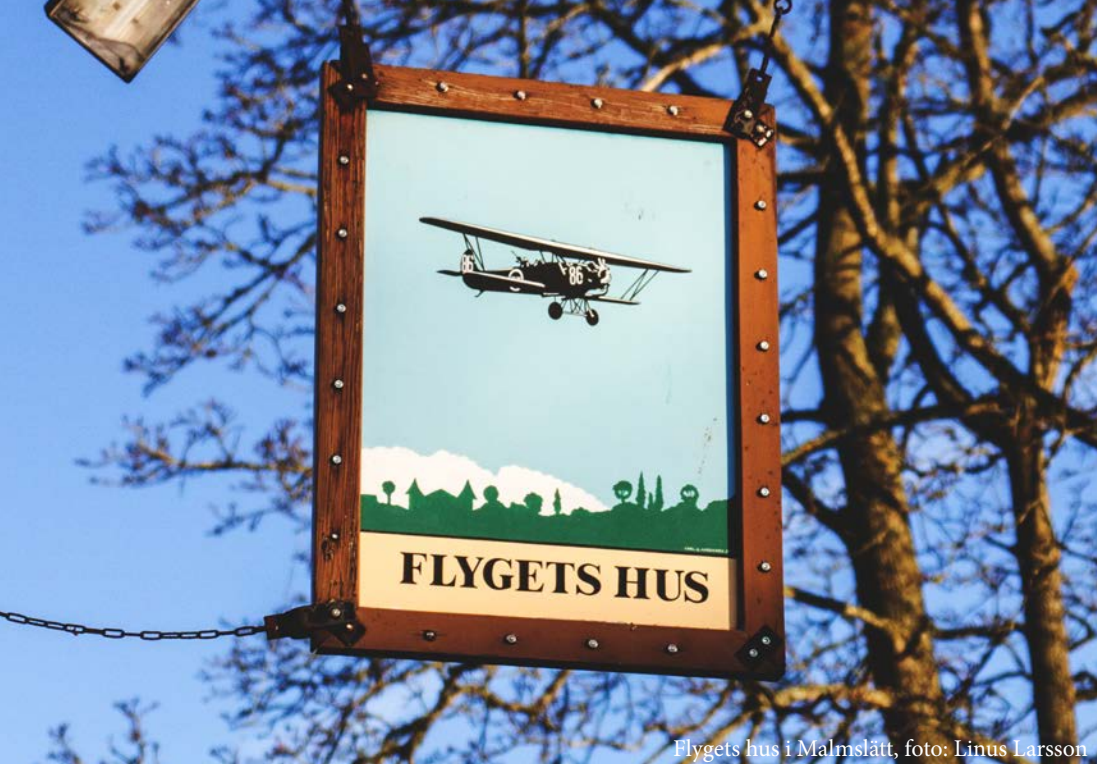
Flygets hus i Malmslätt