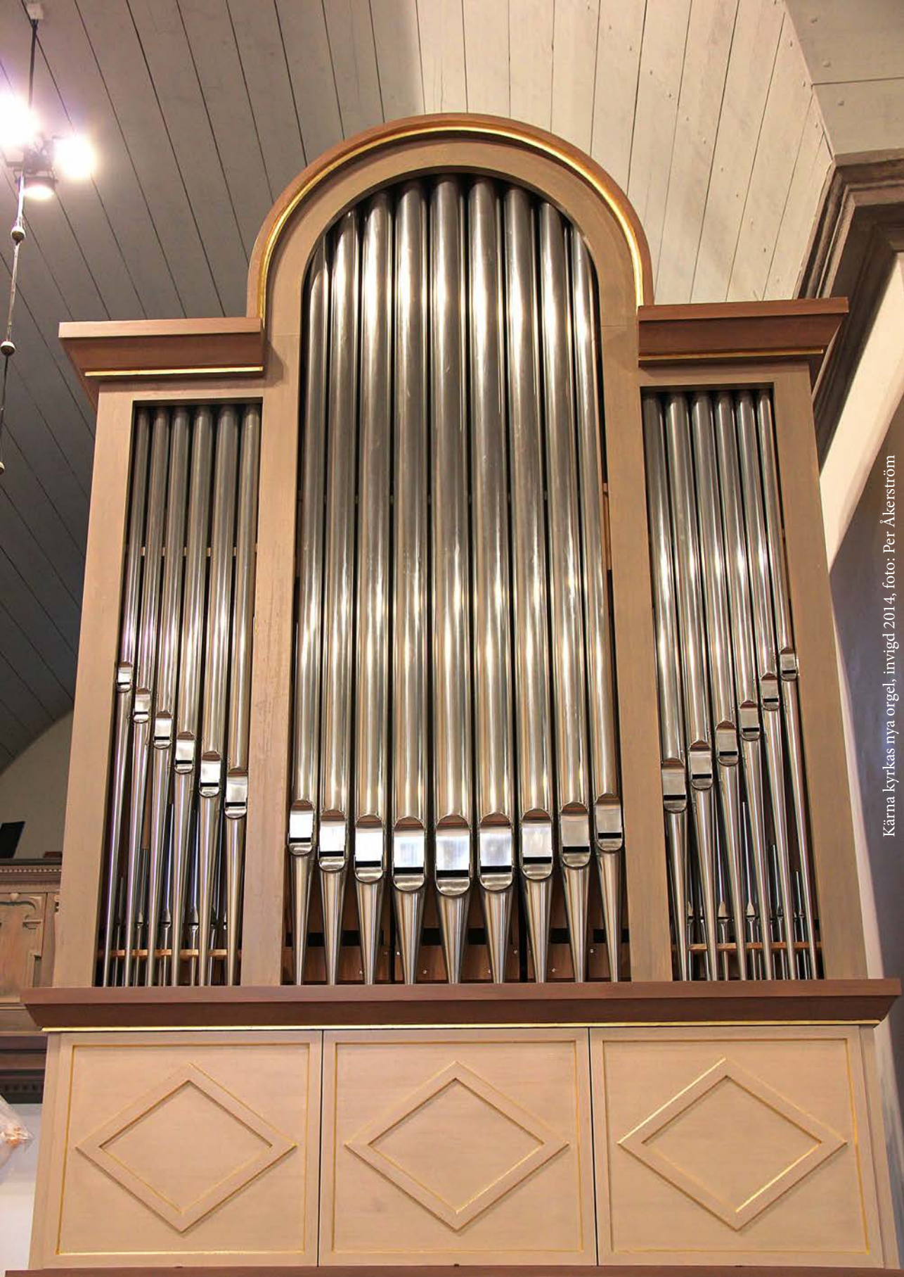
Kärna kyrkas nya orgel, invigd 2014, foto: Per Åkerström