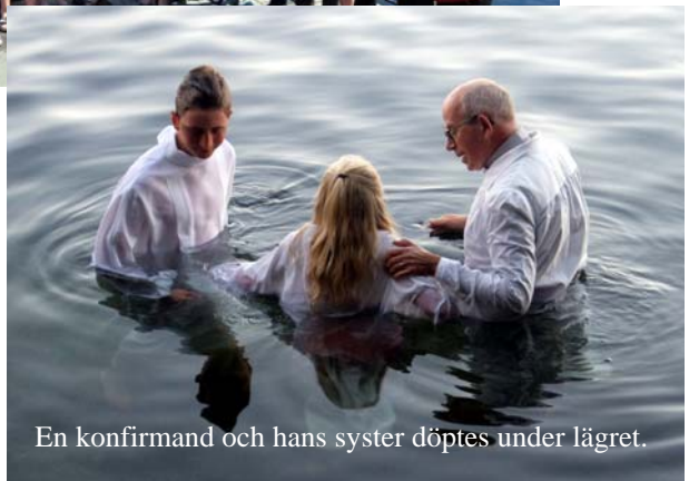
En konfirmand och hans syster döptes under lägret.