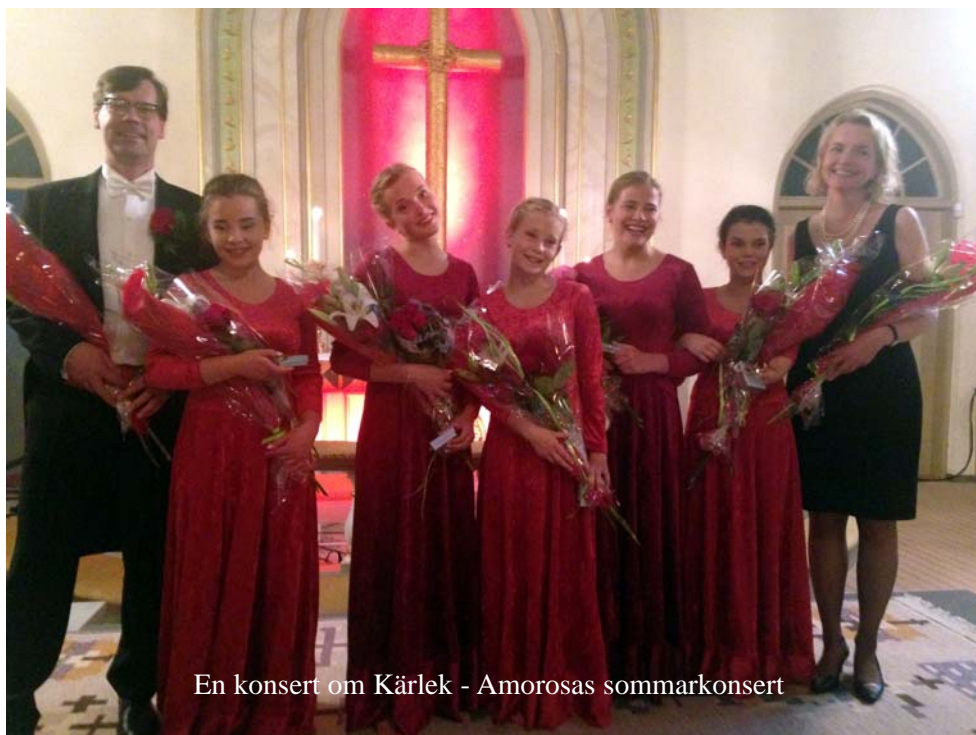
En konsert om Kärlek - Amorosas sommarkonsert

Söndag 27 november. Musikgudstjänst kl 18.00 i Spekeröds kyrka