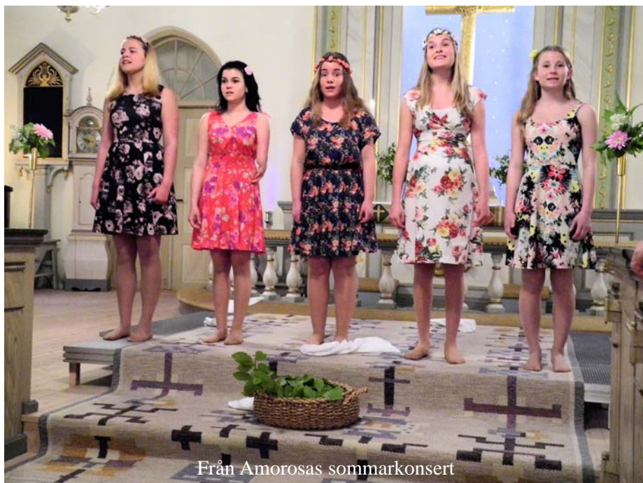
Från Amorosas sommarkonsert

En personlig inbjudan kommer att skickas till årets jubilarer.