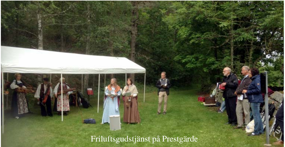
Friluftsgudstjänst på Prestgårde