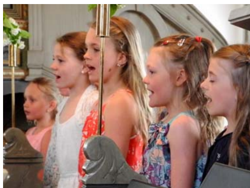
Rosetterna medverkar i gudstjänsten