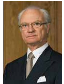
Carl XVI Gustaf