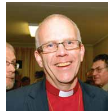
Bild från Biskopsvisitationen 2014.