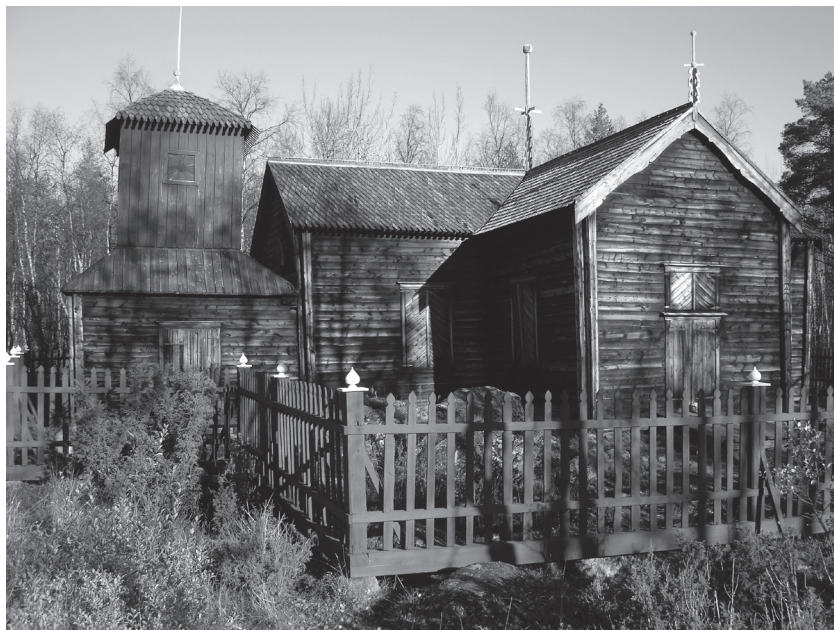
Fig. 1. Ödemarskyrkan i Pielpajärvi utanför Enare i norra Finland. Här byggdes en av Kemi lappmarks två första kyrkor 1647 och namngavs efter drottning Kristina. Sedan den förfallit uppfördes 1760 den kyrka som ses på bilden.