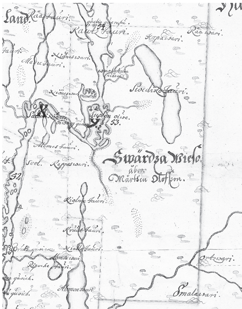
Fig. 2. Innan Sorsele kyrkplats kom till ingick området i lappskattelands Svärdsavieso enligt vad som framgår av Jonas Persson Geddas karta över Umeå lappmark från 1671. Landets samiske äbo hette Mårten Olofsson, i beskrivningen till kartan kallad Mårten Stuut.