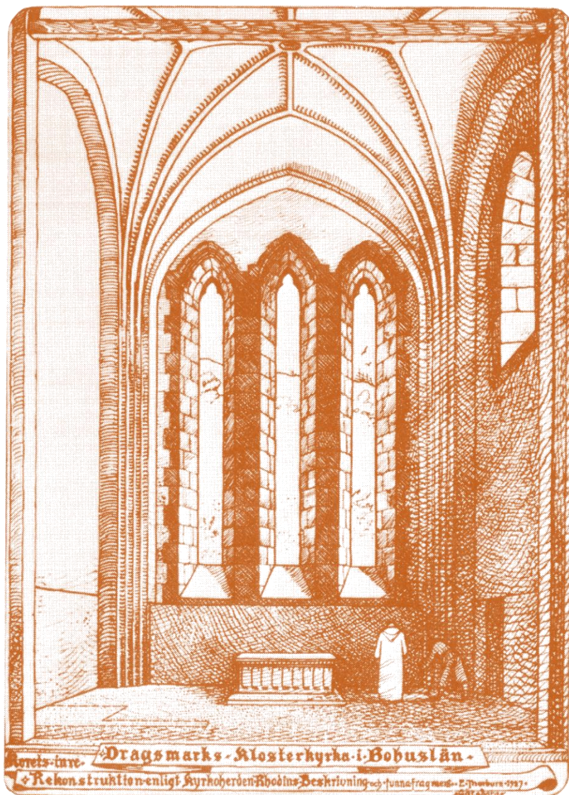
Rekonstruktion av Dragmarks klosterkyrka.

I Dragmarks kyrka har människor kunnat lyssna till tempelsången sedan mer än 700 år tillbaka i tiden.