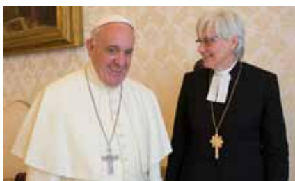
Påve Franciskus och ärkebiskop Antje Jackelén.

Förutom en gudstjänst i Lunds domkyrka kommer påve Franciskus att