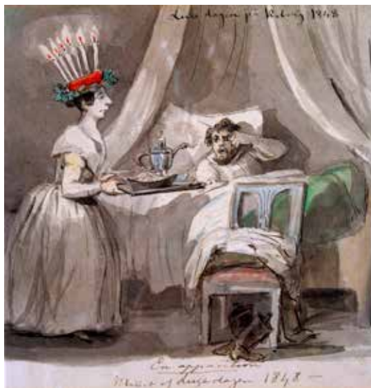
Luciafirande på Koberg i Västergötland 1848. Fritz von Dardel - Nordiska Museet.

Syrakusa på Sicilien. När hon inte ville offra till kejsaren blev hon straffad på ett sådant sätt att hon led döden för sin tro. På senmedeltiden inföll årets längsta natt i Sverige den 13 december. Föreställningen om att Lucianatten fortfarande skulle vara den längsta lever dock kvar. Seden med att fira Lucia har inte alltid sett ut som den gör idag. Innan var det männens festdag då det firades att all förberedelse inför julen var slut. Somliga påstår att seden kommer från tysk tradition, medan andra menar att firandet kan härledas till karnevals seder före julfasten. Inte förrän i början av 1900-talet blir seden allmän och den sprider sig över hela landet då en stockholmstidning på 1920-talet arrangerar en tävling om vem som ska bli Stockholms Lucia. Jesus sade: "Jag är världens ljus". Detta är vad lussandet vill påminna oss om, inte att ljuset driver undan mörkret, men att det lyser i mörkret.