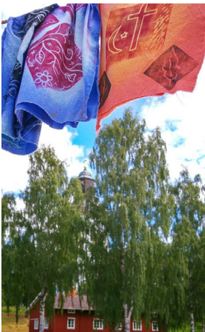
Konstinstallation vid Järvsö kyrka 2016. En kvinna som flytt Syrien har skapat textiltryck med den muslimska halvmånen och det kristna korset sida vid sida.

Flyktingmottagandet i moskén hade hållit på ett par veckor när församlingen kontaktade moskén och frågade