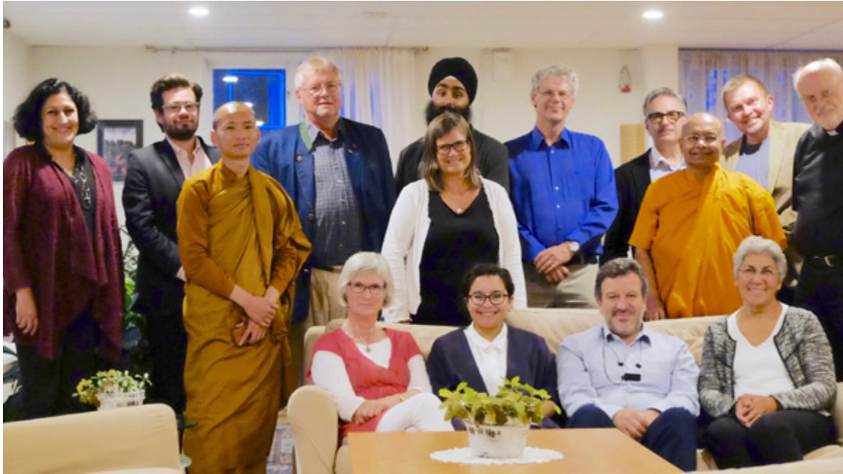
Samfunden inom Sveriges interreligiösa råd turas om att vara värd för rådets möten. I september 2016 samlades några av representanterna, judar, kristna, muslimer, aleviter, buddhister och sikher, hos Svenska Bahaisamfundet i Spånga.