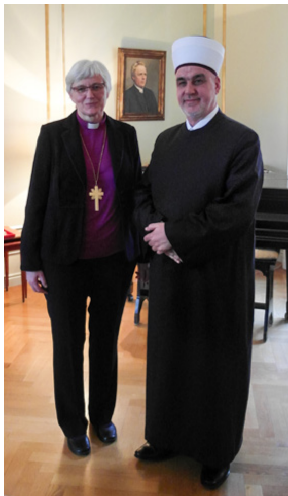
Uppemot 100 000 svenskar har bosniskt ursprung. I oktober 2015 besökte stormuftin av Bosnien och Herzegovina Hussein Kavazovic några av deras församlingar. Stormuftin träffade även ärkebiskop Antje Jackelén i ärkebiskopsgården. I bakgrunden syns Nathan Söderbloms porträtt.

Kyrkomötet initierade 1995 det fleråriga projektet Kunskapsutveckling för mötet med islam, också kallat Svenska kyrkans islamprojekt. Bakgrunden var att det, inte minst på grund av Balkankriget, i allt fler kommuner fanns invånare med muslimsk bakgrund. Det ställde församlingar inför nya teologiska, pastorala och sociala utmaningar, som islamprojektet ville möta.