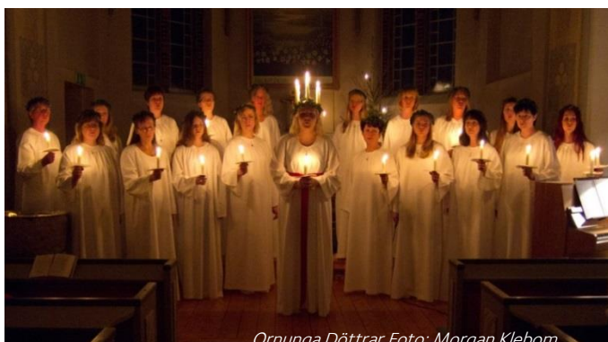
Ornunga Döttrar