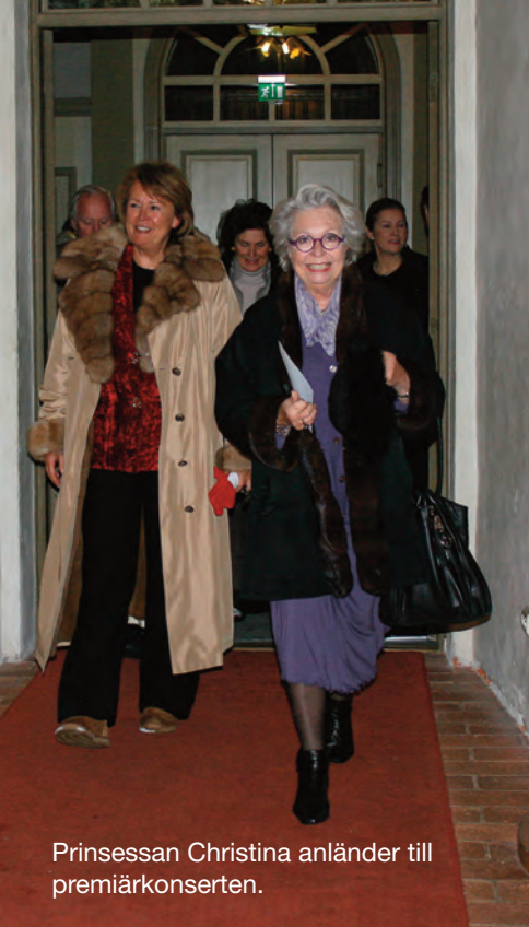
Prinsessan Christina anländer till premiärkonserten.