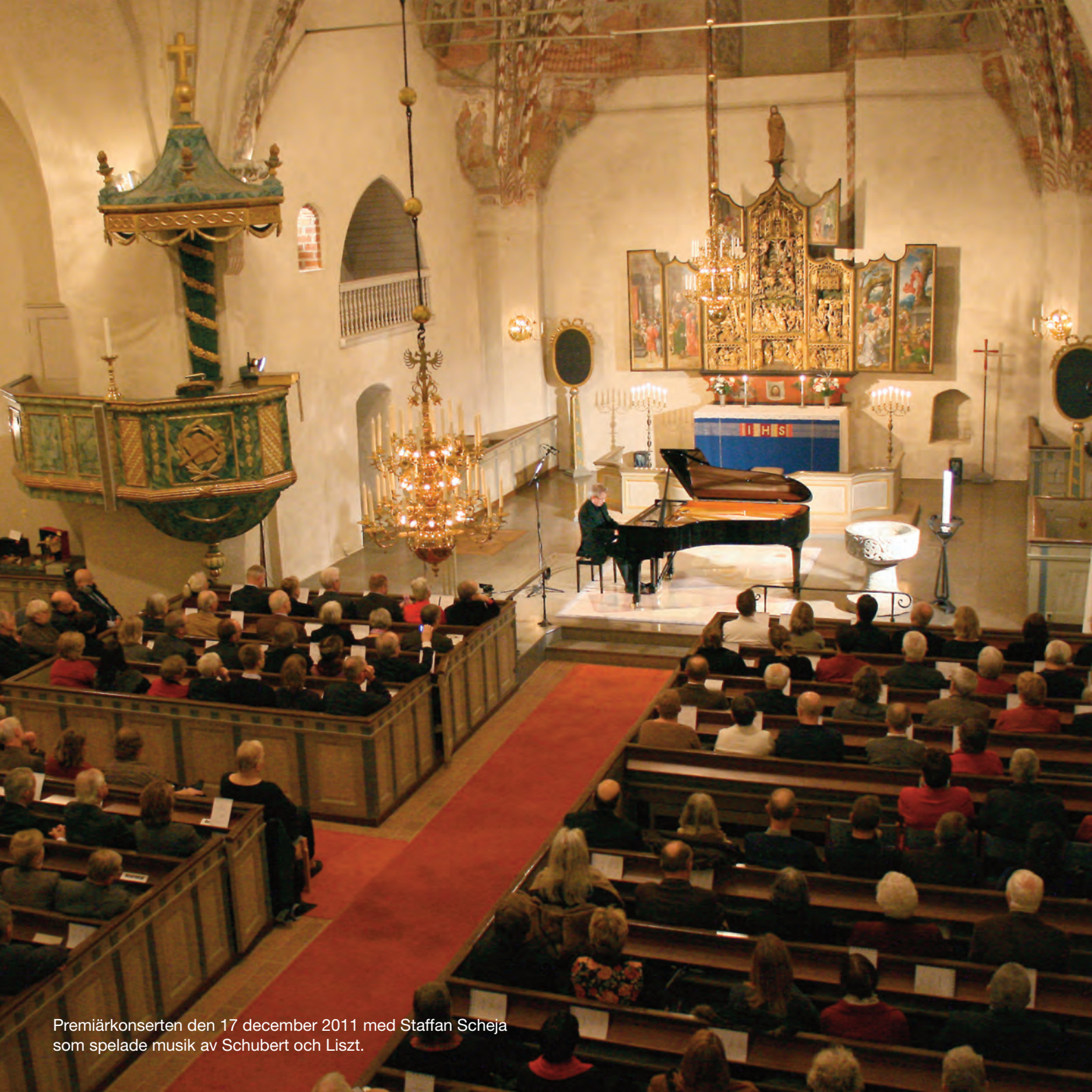
Premiärkonserten den 17 december 2011 med Staffan Scheja som spelade musik av Schubert och Liszt.