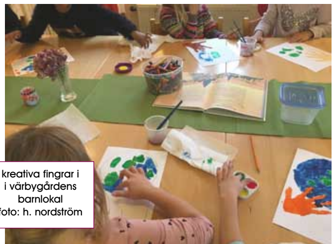
kreativa fingrar i värbygårdens barnlokal