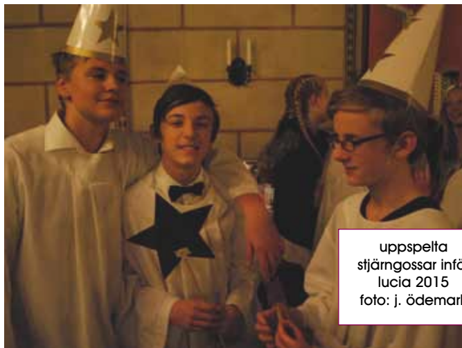
uppspelta stjärngossar inför lucia 2015