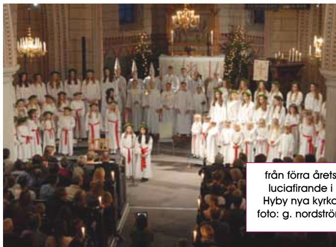
från förra årets luciafirande i Hyby nya kyrka