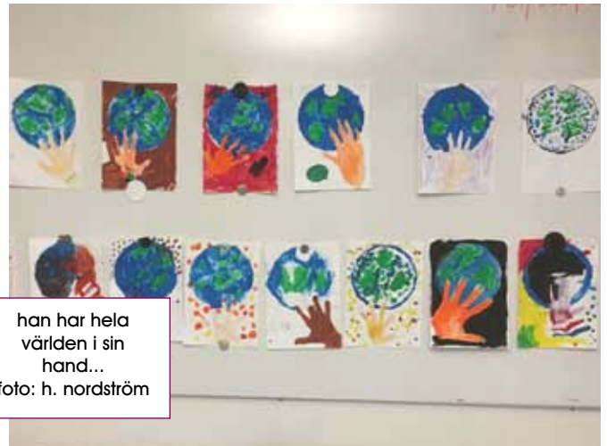
han har hela världen i sin hand...