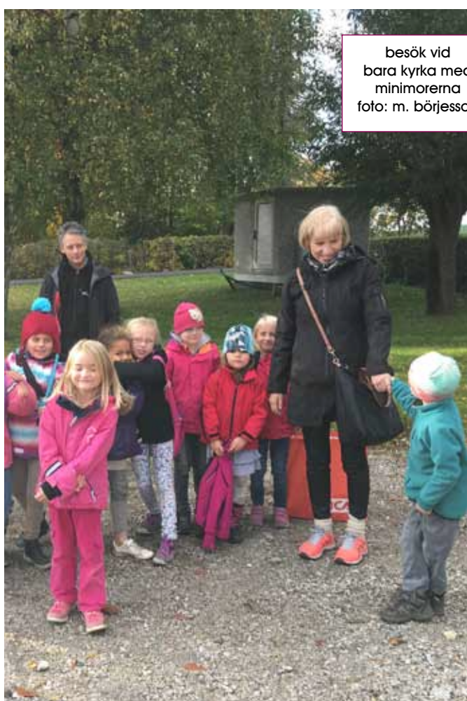
besök vid bara kyrka med minimorerna