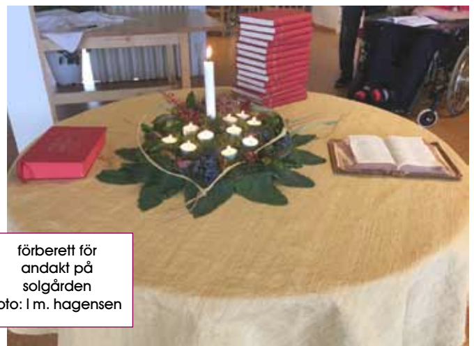
förberett för andakt på solgården