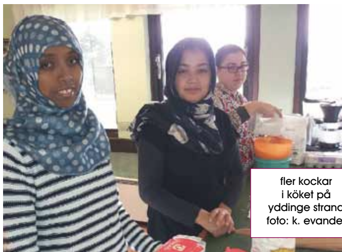
fler kockar i köket på ydinge strand