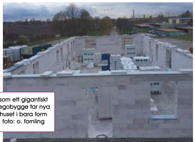
som ett gigantiskt legobygge tar nya huset i bara form