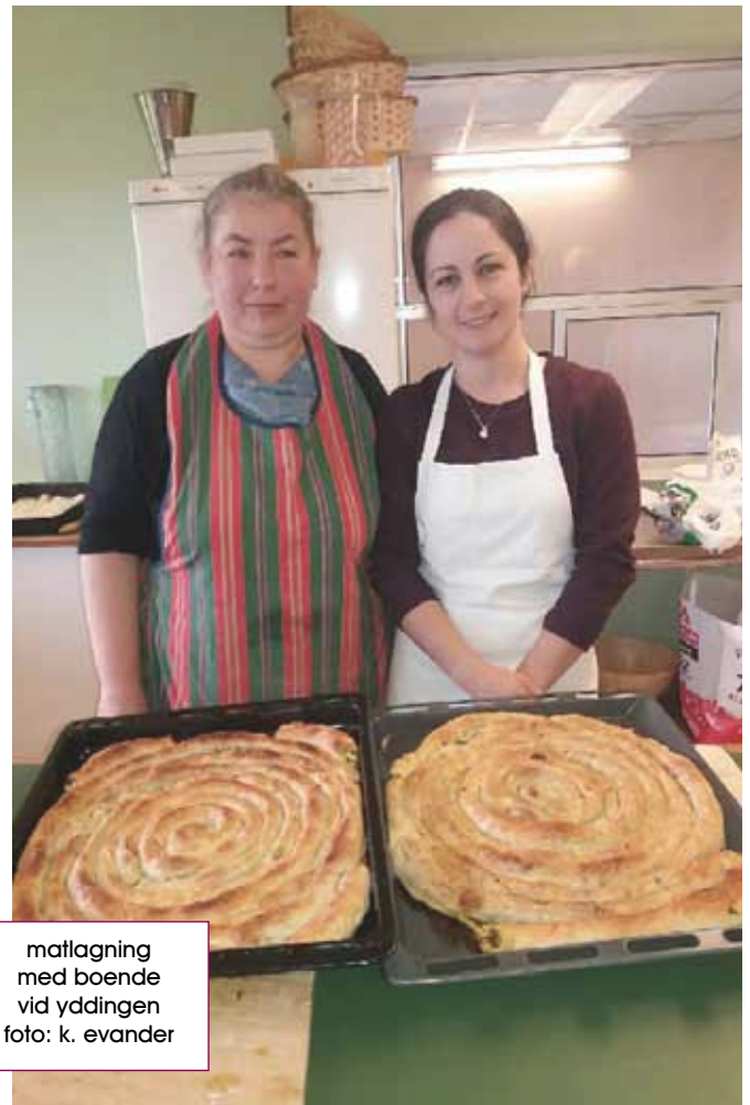
matlagning med boende vid yddingen