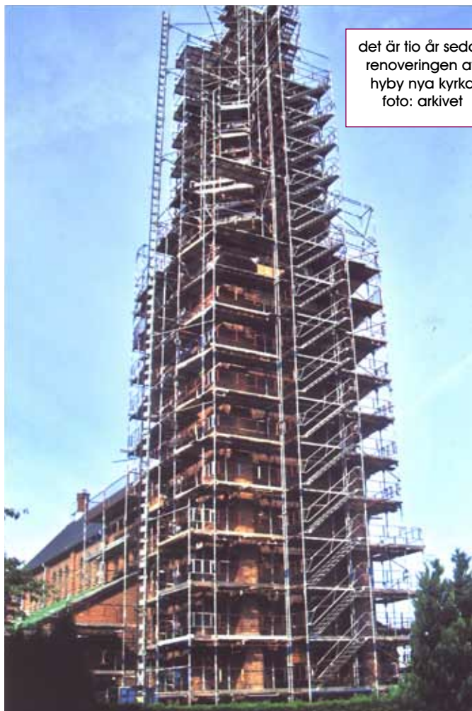
det är tio år sedan renoveringen av hyby nya kyrka