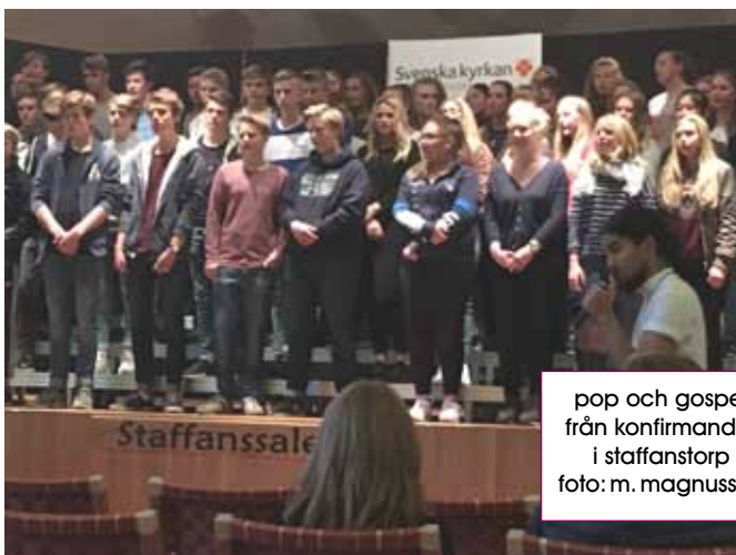
pop och gospel från konfirmander i staffanstorp