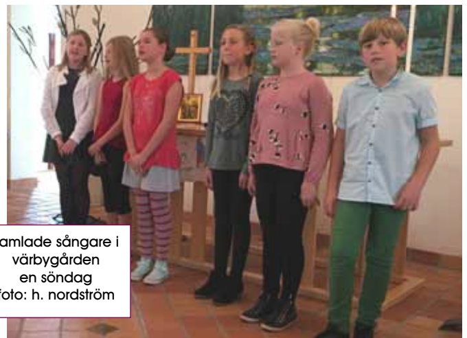
samlade sångare i värbygården en söndag