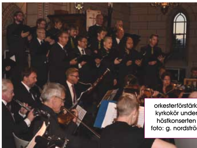
orkesterförstärkt kyrkokör under höstkonserten