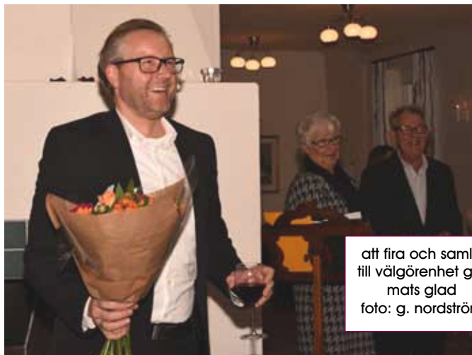
att fira och samla till välgörenhet gör mats glad