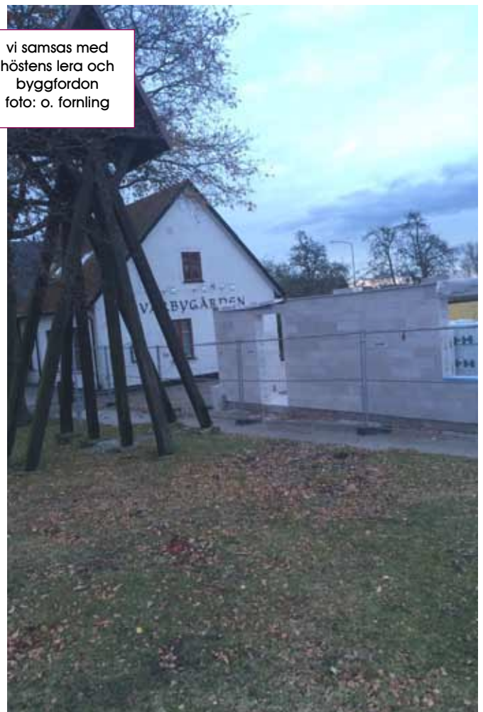
vi samsas med höstens lera och byggfordon