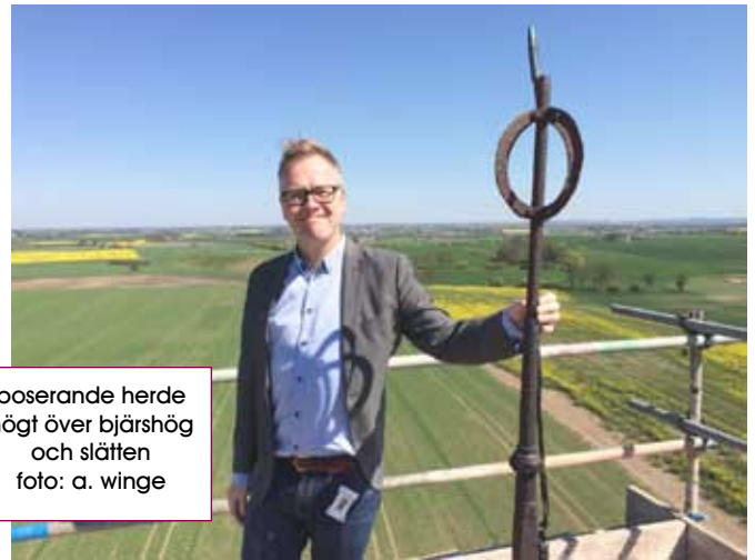
poserande herde högt över bjärshög och slätten