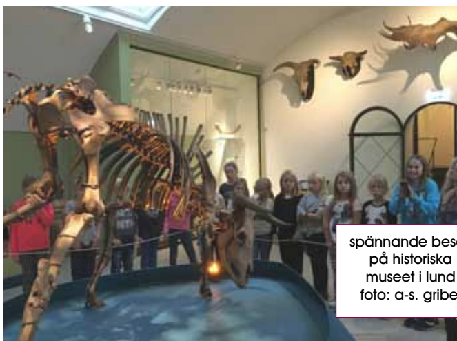
spännande besök på historiska museet i lund