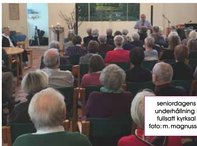
seniordagens underhållning i fullsatt kyrksal