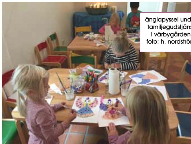
änglapysssel under familjegudstjänst i värbygården