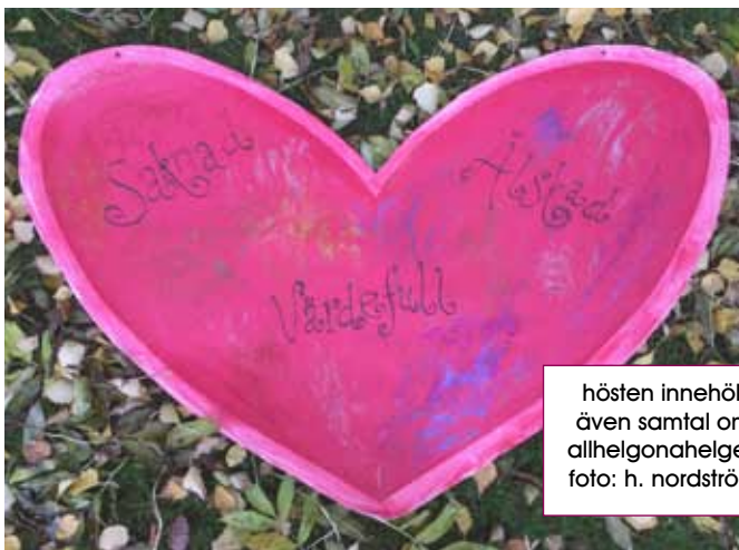
hösten innehöll även samtal om allhelgonahelgen