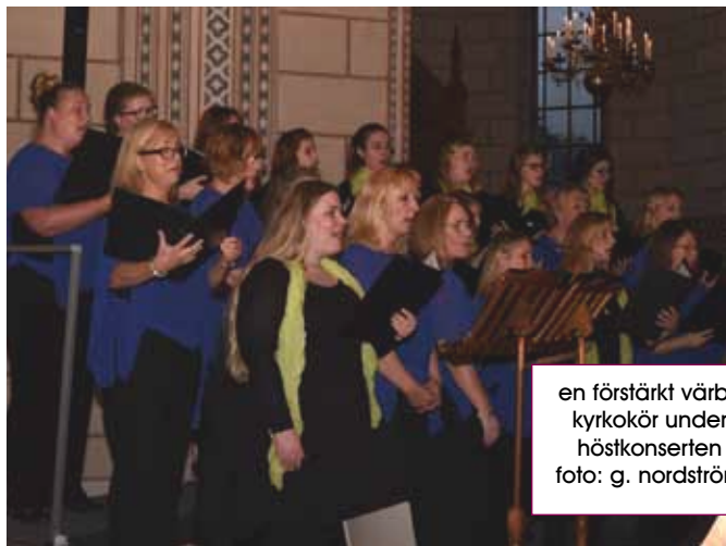
en förstärkt värby kyrkokör under höstkonserterna