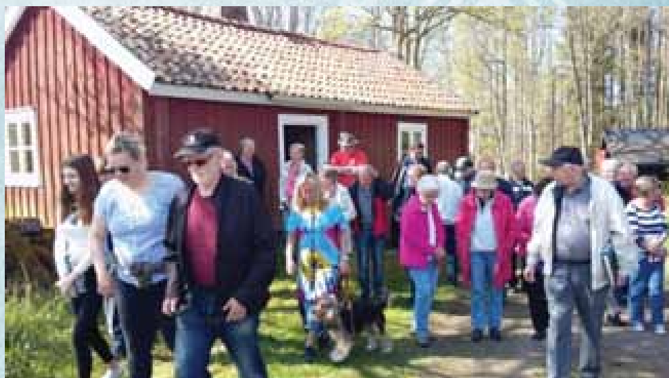
Sockenvandring på Kristi Himmelfärds Dag i maj

15 maj - en gemensam församlingsfest för alla åldrar firades på Pingstdagen i Mortorps kyrka och efteråt var det mingel och grillning m.m. Nästa år blir det Karlslunda tur.