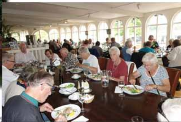
Lunch vid Möckelnäs herrgård