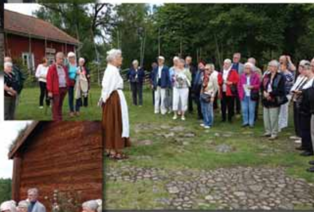
Guidning i Lustgården