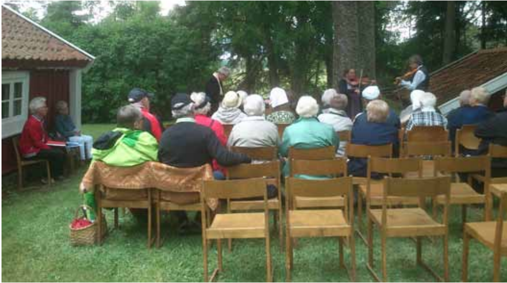
Friluftsgudstjänst vid Värnabystugan