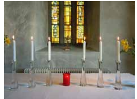
Nya ljusstakar i Voxtorps kyrka