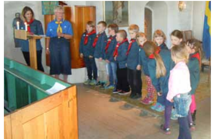
S:t George gudstjänst