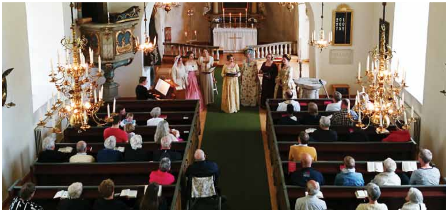
Kvällsmusik i Arby kyrka