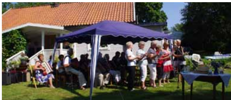
Friluftsgudstjänst i Ålebo