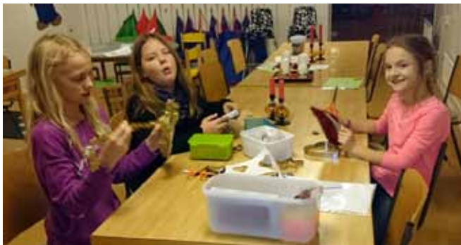
Under våren och hösten har det troget varit tre tjejer på "Änglakul". Vi har pysslat och gjort kollage om Noas ark.