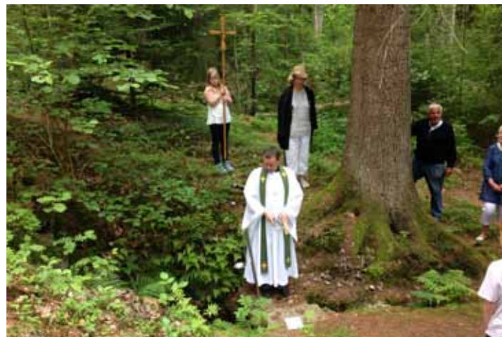
S:t Sigfrids källa i slutet på Östra Sigfridsleden

Pilgrimsvandring är mer än en promenad, det är en del av livsvandringen.