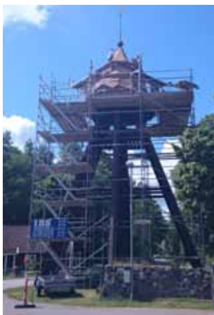
Under tre veckors intensivt arbete byttes det gamla spåntaket ut (från 1840-talet) på klockstapeln i Karlslunda av kyrktaksexperten från Norrköping.