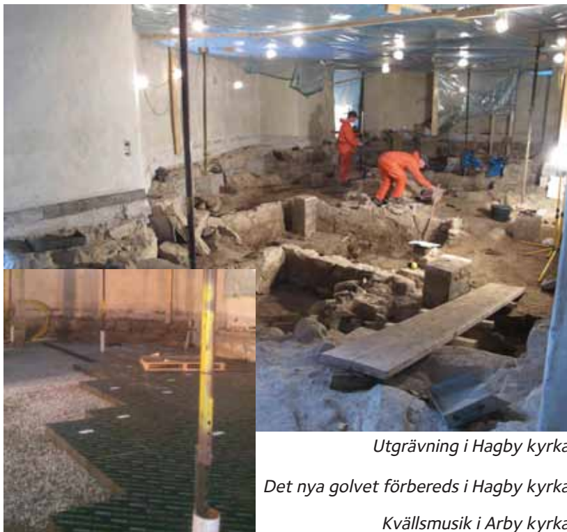
Utgrävning i Hagby kyrka