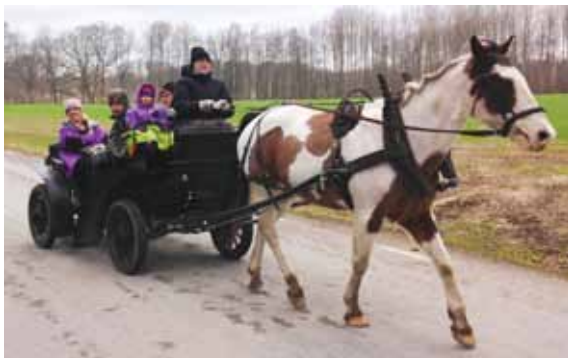
Gemensam pilgrimsvandring med guidning.