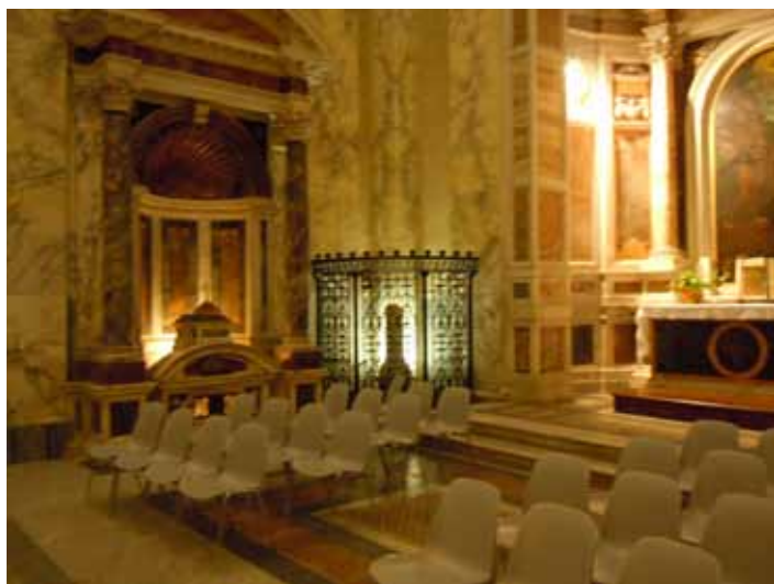
På denna kolumn, den lilla pelaren i hörnan högs Paulus huvud av. Tre gånger föll huvudet och är ännu idag tre vattenkällor. Platsen heter därför Tre Fontana.