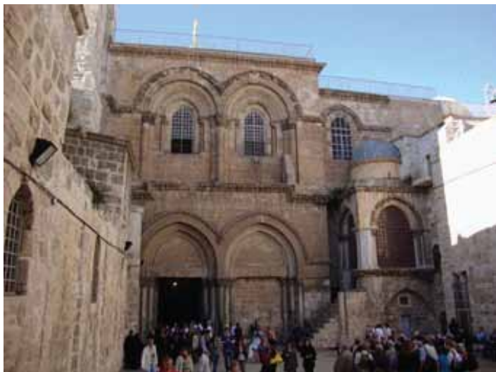
Bild 1 - Ingången till Heliga gravens kyrka i Jerusalem.

I Jerusalem finns en kyrka med särskild anknytning till det kristna påskfirandet. Det är Heliga gravens kyrka som ligger i den kristna delen av Jerusalem just på den plats där Jesu död och uppståndelse sägs ha ägt rum.