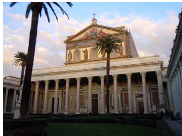
San Paolo kyrkan fuori le Mura där Paulus begravdes.

Fyra dagar senare insåg gruppen att en pilgrimsresa till Rom skall erbjudas till fler hemma i våra församlingar för utbildning och kristen trosuppbyggelse.