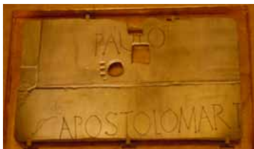
Bevarat är Paulus yttre kistlock genom vilken pilgrimmen kan känna på originalsarkofagen.

De äldsta kyrkorna har ett baptisterium, ett särskilt rum, ett hus för dop. Denna heliga lokal bör helst vara rund eller åttakantig med en basäng i mitten där dopet sker genom att hela människan doppas. Vi gick som det bör till Roms äldsta baptisterium som är Johanneskyrkans doplokal. Här påstår traditionen att Konstantin den store blev döpt. Den mer troliga sanningen är att han blev döpt i sin säng på sin dödsbädd.