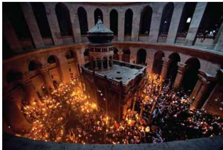
Bild 3 – Kring det lilla gravkapellet står påskfirare med ljus som tänts med den heliga elden från den inre gravkammaren.

"Jesus sade: –Jag är världens ljus. Den som följer mig ska inte vandra i mörkret utan ha livets ljus." Joh. 8:12