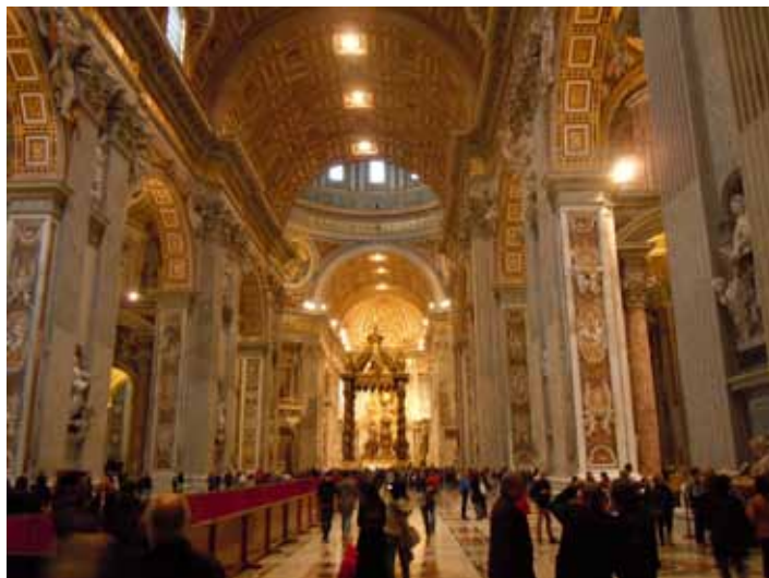
Här här Petrus grav och ett av pilgrimens slut-/ delmål.

Efter enskild bön gick vi vidare in till San Giovanni in laterano , heliga Johanneskyrkan på laterano. Vi var framme vid pilgrimsresans första delmål, nämligen vid relikerna av Petrus och Paulus huvud vilka är bevarade i högaltarets baldakin.