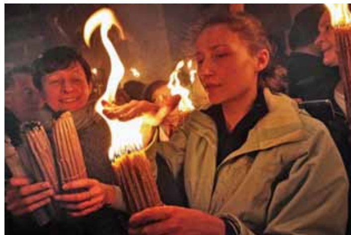
Bild 2 - Kvinna rör vid den heliga elden utan att bli skadad och bränd.