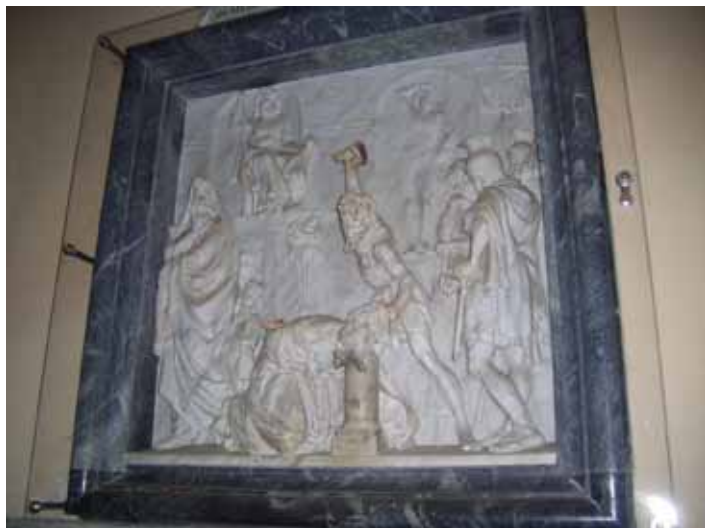
Avrättningen av Paulus.