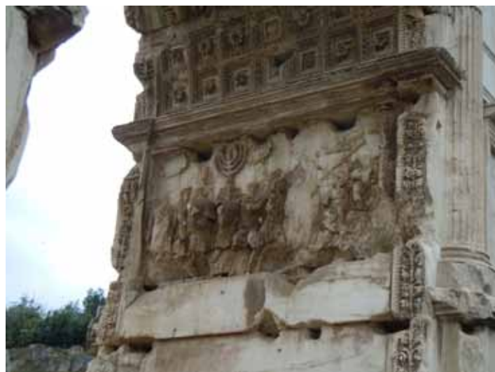
Den sjuarmade ljustaken som fanns i Jerusalems tempel.