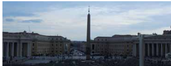
Här vid denna obelisk på ett upp och nedvänt kors avrättades Petrus.