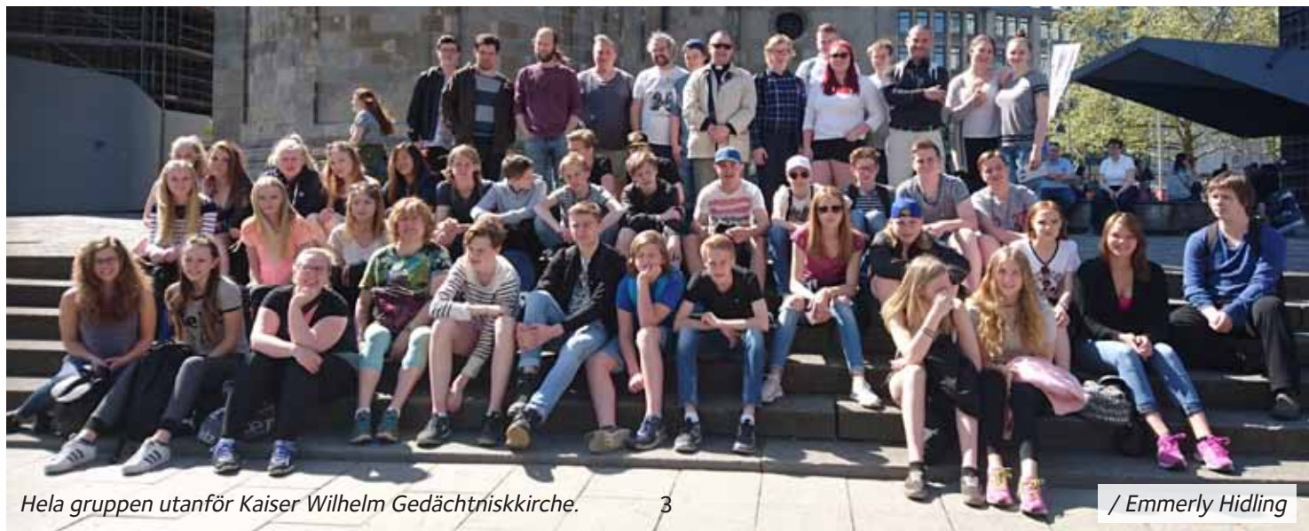
Hela gruppen utanför Kaiser Wilhelm Gedächtniskirche.