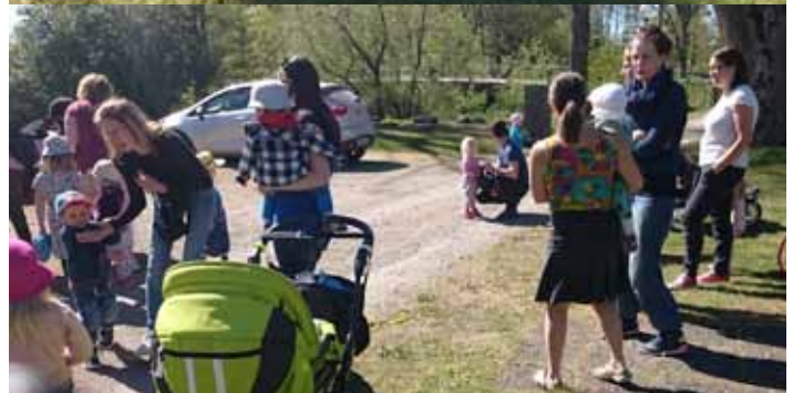
Kyrkis hade avslutning i Arby med tårta och korv.