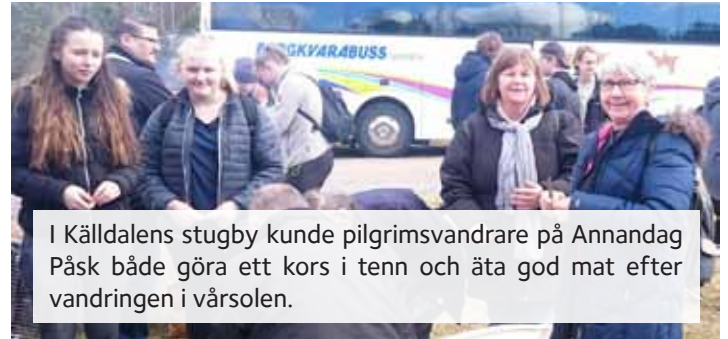
I Källdalens stugby kunde pilgrimsvandrare på Annandag Påsk både göra ett kors i tenn och äta god mat efter vandringen i vårsolen.