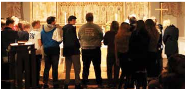
Askeryds kyrka konfirmander 2016

I höst har vi hunnit med att både ha en helgutbildning i Vandra genom Bibeln , där vi togs på en hisnande färd genom hela Gamla Testamentet. Vi lärde oss rörelser för att kunna komma ihåg och vi fick nya kunskaper om berättelser ur gamla testamentets böcker. Våra Unga Ledare fick massor av nya kunskaper, och erfarenheter av Bibeln. Vi har också hunnit med att delta i Nattkampen , ett arrangemang som Svenska kyrkans Unga har varje år. Nattkampen går ut på att olika lag av ungdomar genom en lång vandring mitt i natten, får utmanas vid olika stationer där man ska redovisa kunskaper i allt från bibelns värld till sjukvård. Det är oerhört skoj, kallt och framförallt roligt.