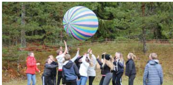
Konfirmationslägret i Gransnäs