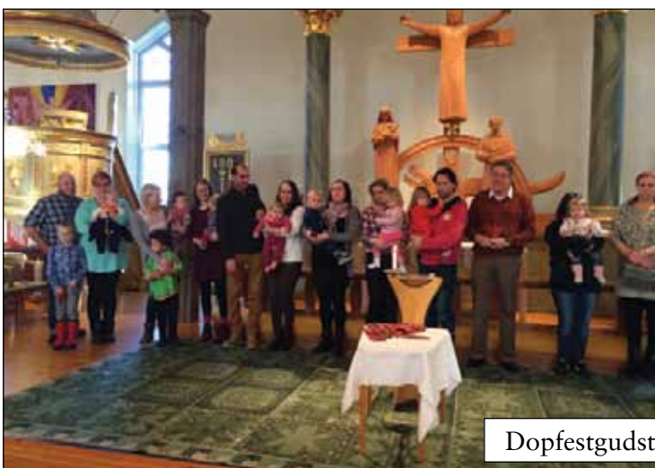
Dopfestgudstjänst 8 februari