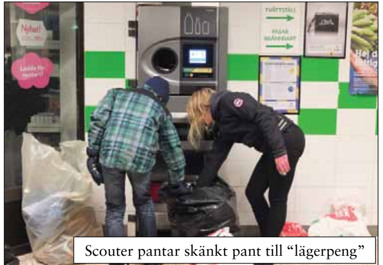
Scouter pantar skänkt pant till "lägerpeng"