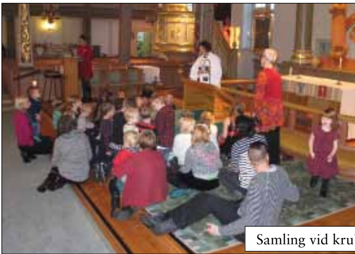
Samling vid krubban 24 december