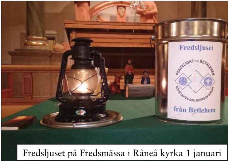
Fredsljuset på Fredsmässa i Råneå kyrka 1 januari