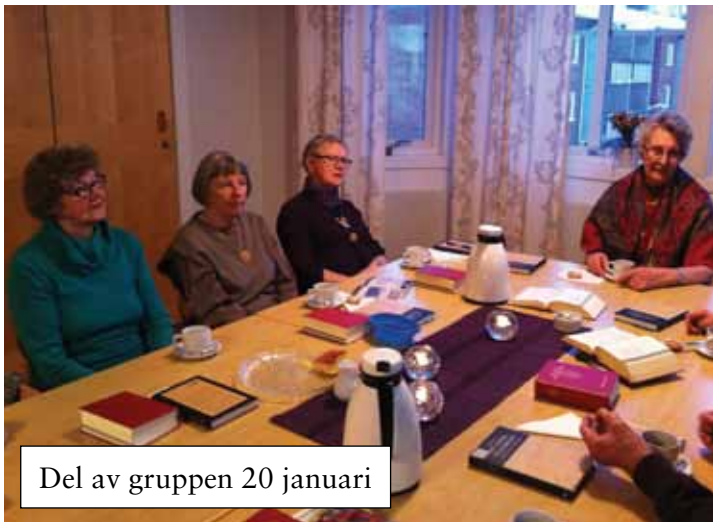
Del av gruppen 20 januari