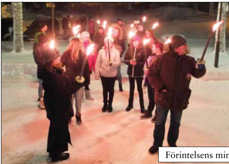
Förintelsens minnesdag 27 januari