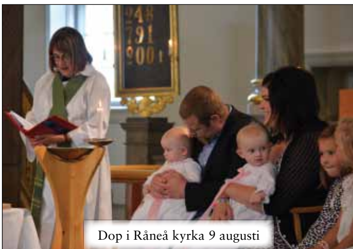
Dop i Råneå kyrka 9 augusti