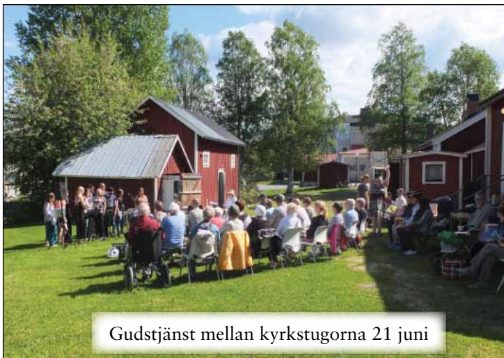
Gudstjänst mellan kyrkstugorna 21 juni