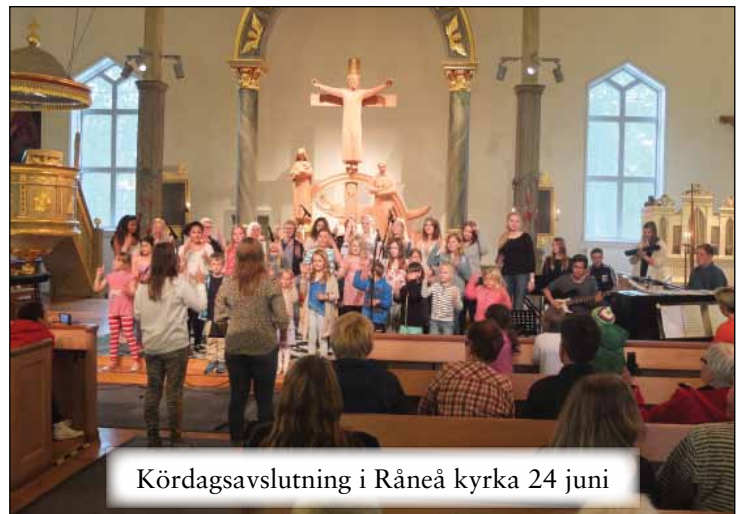
Kördagsavslutning i Råneå kyrka 24 juni