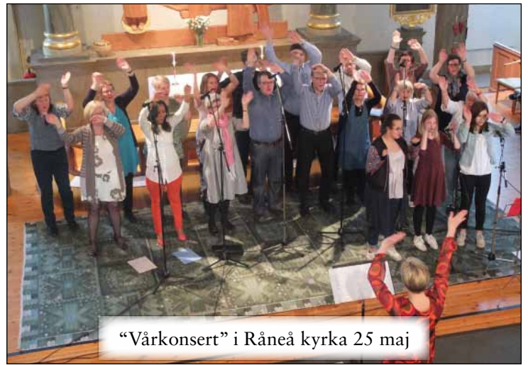
“Vårkonsert” i Råneå kyrka 25 maj