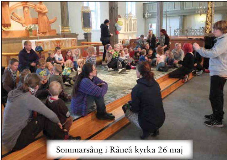
Sommarsång i Råneå kyrka 26 maj