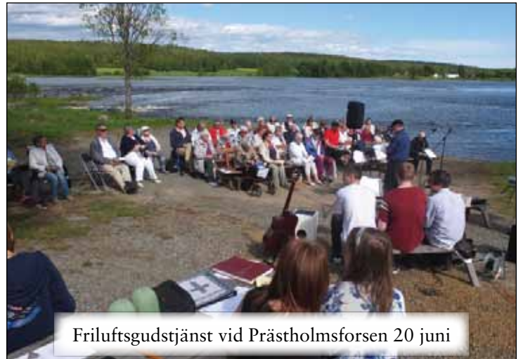
Friluftsgudstjänst vid Prästholmsforsen 20 juni