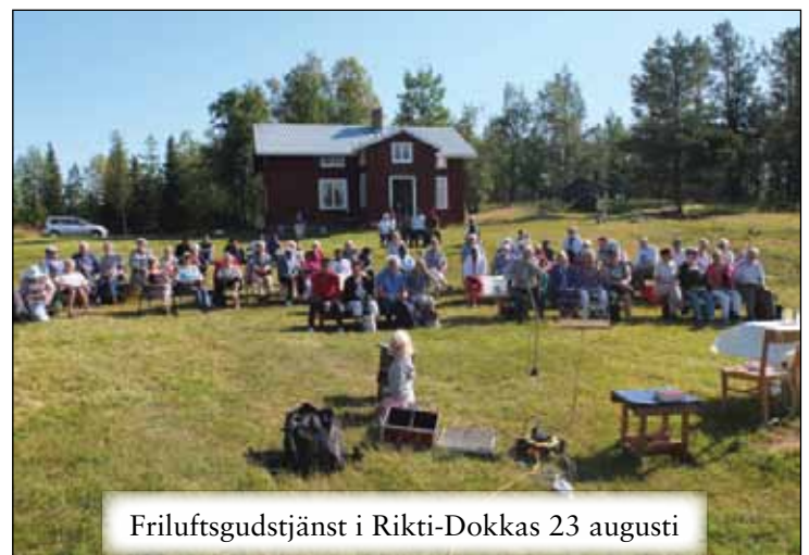
Friluftsgudstjänst i Rikti-Dokkas 23 augusti