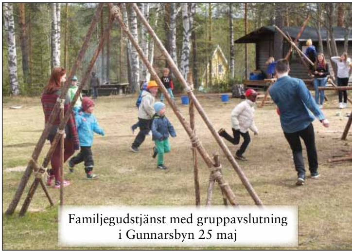
Familjegudstjänst med gruppavslutning i Gunnarsbyn 25 maj