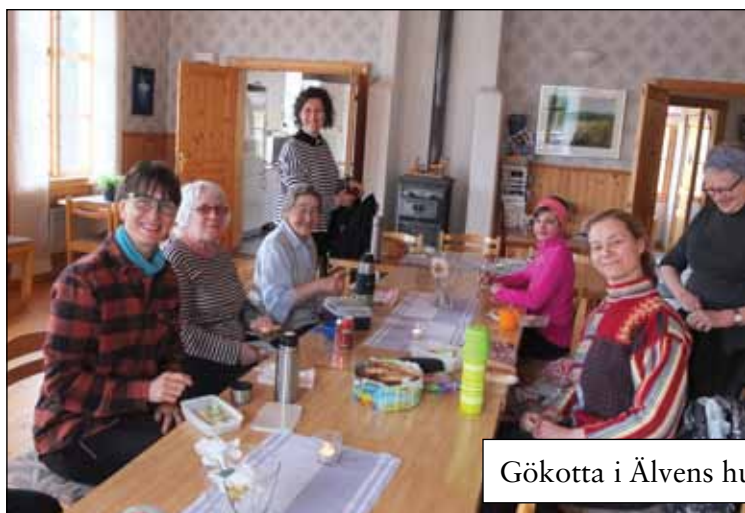
Gökotta i Älvens hus, Niemisel 14 maj