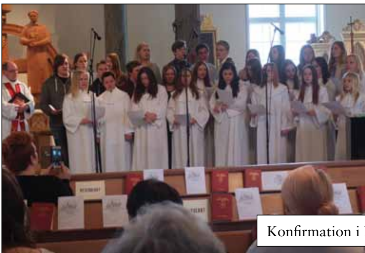
Konfirmation i Råneå kyrka 3 maj