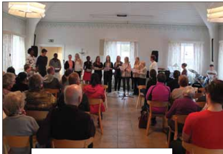
Ekumeniska mötesserien 7-10 maj