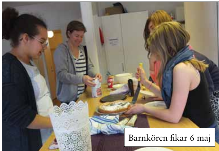
Barnkören fikar 6 maj