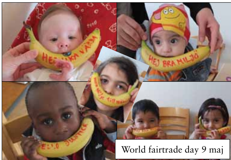
World fairtrade day 9 maj