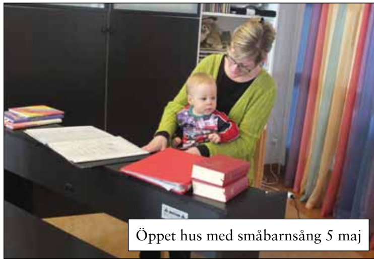
Öppet hus med småbarnsång 5 maj