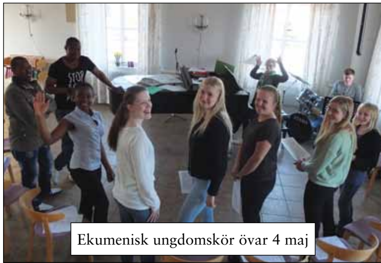
Ekumenisk ungdomskör övar 4 maj